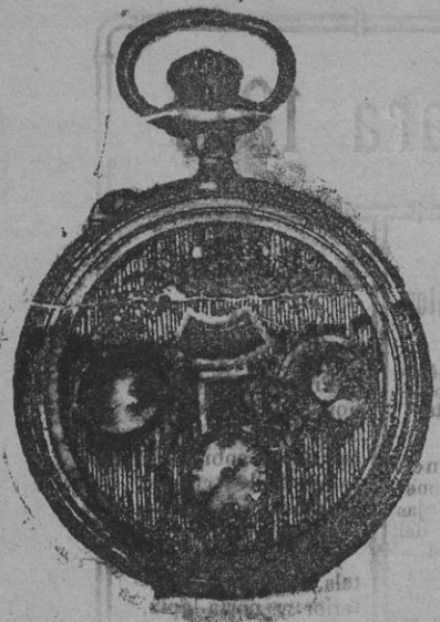
El maravilloso reloj automático