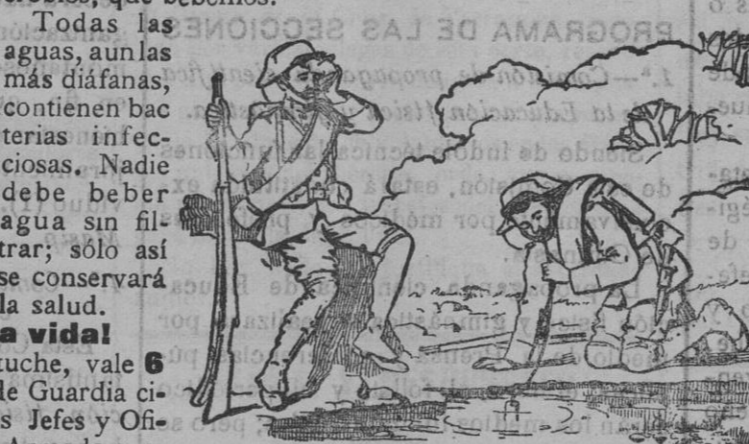
Grabado núm. 2.

Madrid.—FARMACIA, 6, principales.—Apartado de Correos núm. 329