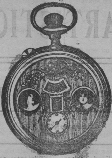
El maravilloso reloj automático.

Para este servicio rigen rebajas especiales en pasajes de ida y vuelta y también precios convencionales para camarotes de lujo.