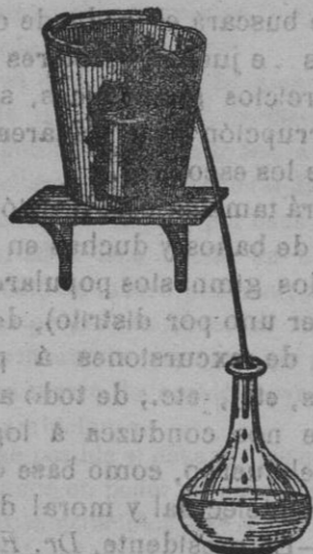
Grabado núm. 1.

PARA USO DOMÉSTICO: se conservará la salud.