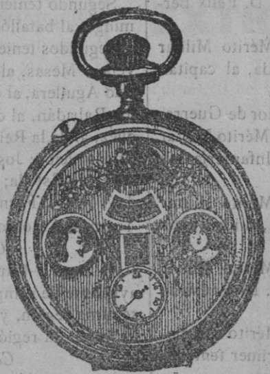
El maravilloso reloj automático.

THIERRY.—GRAN RELOJERÍA DE PARÍS FUENCARRAL, 59.—MADRID