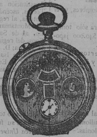
El maravilloso reloj automático