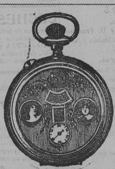
El maravilloso reloj automático