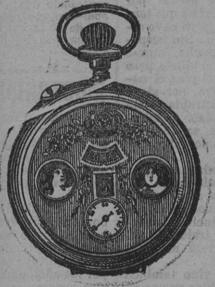
El maravilloso reloj automático NÚM. 2

Precios del frasco: amarillo, 1'50 pesetas; blanco, 1'50; negro intenso, 0'50; avellana, 0'50. Los pedidos, de 20 frascos en adelante, se sirven francos de porte y embalaje á la estación más próxima.