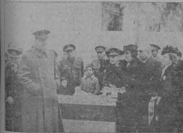
Esposa del Comandante Militar en el momento de hacer entrega de los diplomas a las enfermeras de la Cruz Roja