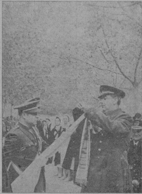
El General Kindelán imponiendo la Corbata de la Cruz de Beneficencia a una bandera de la Cruz Roja

ofensiva soviética en el norte de Finlandia. Las tropas finlandesas se batían en retirada causando numerosas bajas al enemigo. NO ES COSER Y CANTAR Moscú.— Los hospitales de la ciudad se encuentran completamente abarrotados de heridos, principalmente a causa de explosiones de minas, presentando estos heridos graves en la cara. En Leningrado durante la noche existe una oscuridad completa lo que favorece los robos y los ataques a mano armada. EL SR. KALIO HABLO AYER POR RADIO Helsinki.— Ayer habló por radio el presidente de la república Sr. Kalio que se dirigió especialmente al ejército finlandés. También habló por radio la Sra. Kalio, esposa del presidente de la república dirigiéndose a las mujeres invitándolas a enviar paquetes a los soldados con motivo de las próximas Fiestas.