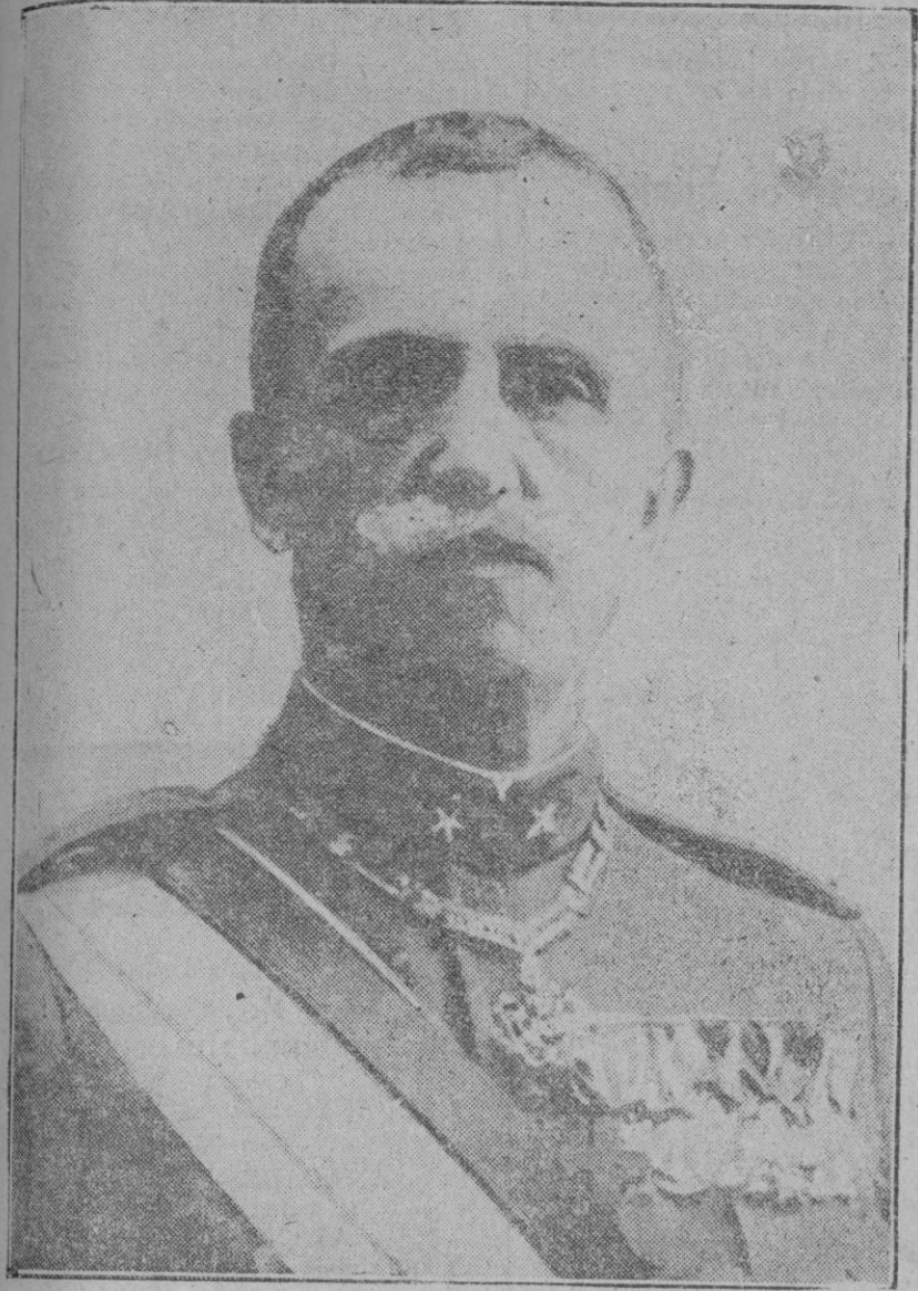
HOY, DIA 11 DE NOVIEMBRE

Para el pueblo italiano, amigo y hermano nuestro, es hoy una fecha de altísima significación. Y por dolo concepto. Para el país hermano el advenimiento al trono de su actual Rey, que es también Emperador de Etiopia y Rey de Albania, encierra el germen de su consolidación y de su engrandecimiento. Y hoy, 11 de noviembre, cumple el monarca italiano los setenta años de su vida. Victor Manuel III, elevado al trono al morir violentamente su padre, ha sido el rey consolidador. Bajo su mando ha sufrido Italia vicisitudes y ha pasado peligros. En busca de su fortaleza interior y de su engrandecimiento que le diera el rango político internacional que había de corresponder, por su historia y por su personalidad, a la sede del viejo y glorioso imperio de los Césares, ha sostenido varias guerras (la de Turquía, la de Etiopia, y su intervención en la Gran Guerra de Europa), incorporando a su bandera la Tripolitania y la que durante tantos años se llamó la Italia irredenta y el imperio abisinio; logró zanjar en paz las dificultades viejas con el Vaticano, y aseguró su vida y su grandeza, echando de sí a los enemigos to-