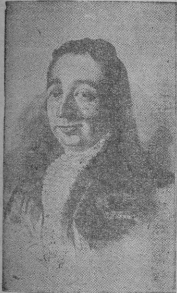
JOSE DELGADO «PEPE-HILLO»

Entre los grandes espadas que forman la historia Taurina, este es sin duda el más popular de todos los habidos. Aseguran las antiguas crónicas, que JOSEPH DELGADO «HILLO», era de carácter dádivo, jovial, fanerero y gallardo. Torero al estilo clásico, en el ruedo y en la calle, fué héroe de los más populares romances del siglo XVIII.