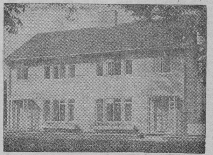
Vista de una casa pre-fabricada de la serie «Wates» que se están levantando en Inglaterra, para cooperar con rapidez a la reconstrucción de la nación y a la solución del grave problema de la vivienda.