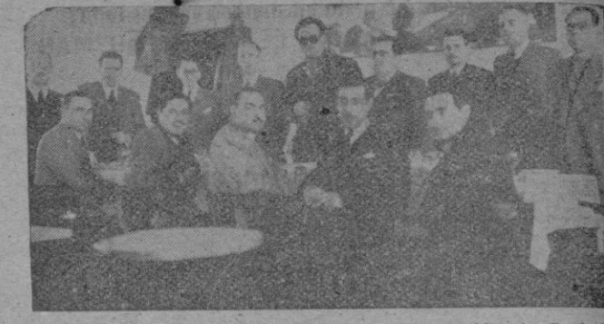
...con motivo de la reorganización de la Asociación de Periodistas Deportivos, se reunieron en una comida íntima.