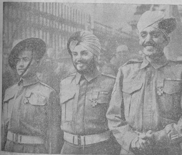
Tres soldados indios que han recibido la Victoria Cross, preclásica condecoración, de manos del Rey en el Palacio de Buckingham, como recompensa a su brillante actuación en la campaña de Birmania.