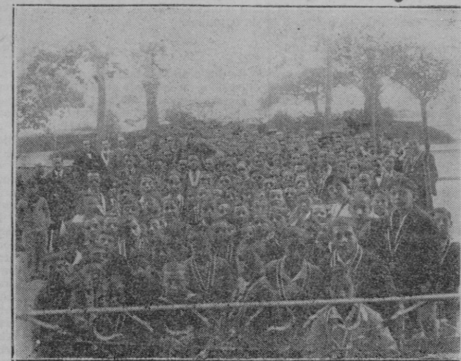
Los jóvenes que componen la Juventud Antoniana, frente al local social.