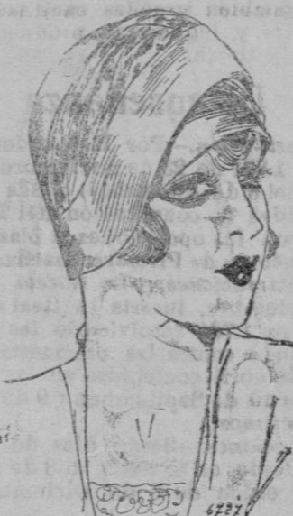
SOMBRERO.—Turbante de fieltro negro y salambó plata.