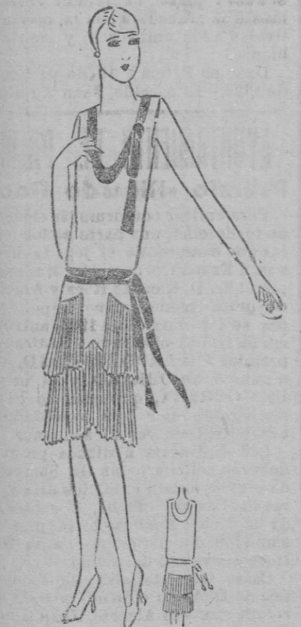
VESTIDO.—Vestido de crepón china blanco. Volante plisado sol. Cinta lamé plata.