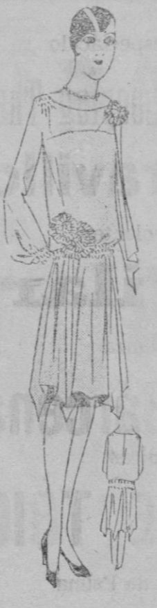
VESTIDO.—Vestido de Geo gris sobre «fourras» de crepón de saion gris. Falda fruncida y recortada abajo. Motivos en cintas de satén negro.