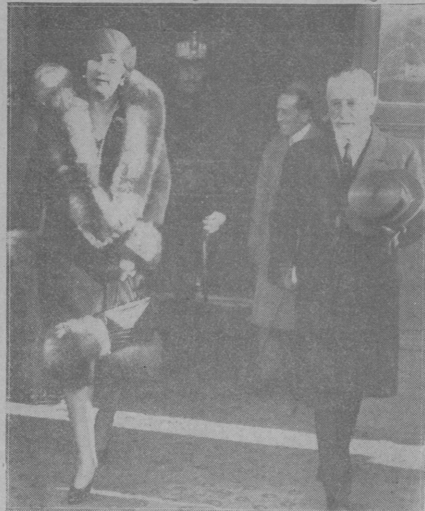
MADRID.—Su Majestad el Rey y Doña Victoria en el momento de llegar a la Corte de registro de su viaje por Francia e Inglaterra.

Por tanto, el esfuerzo de los agricultores mallorquines que tiende a la solución de un problema tan importante como el que se plantea al comenzar estas líneas, debe ser visto con cariño y estimulado por los elementos directores, estableciéndose, entre ambos, la cooperación tan necesaria encaminada a conseguir que la tierra de todo su rendimiento en provecho de la riqueza del país.