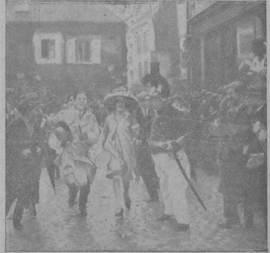
PARÍS.—Uno de los actos del programa que componen las pintorescas fiestas que celebran las modistillas de esta capital que habiendo cumplido veinticinco años permanecen solteras. En esta fotografía se ve la «marcha de las Cathedrales», consistente en llevar una cruz con un vestido y un sombrero desde Montparnasse a la Plaza de Terreo, en tiempo más corto, viéndose a la medida a vercedora en el momento de terminar la carrera.