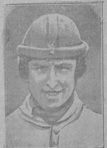
El famoso corredor ciclista belga Leduck muerto recientemente al caerse de la bicicleta durante una carrera celebrada en Fransport. Le duck tenía 29 años.

—Por favor, déjeme dos pesetas para poderme juntar con mi familia. —Y, ¿dónde está tu familia? —En el cine.