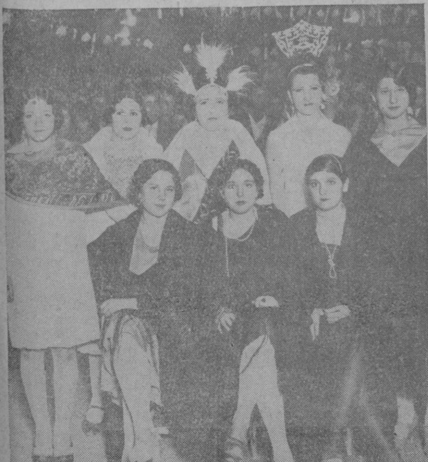
MADRID.—Grupo de señoritas que, en la fiesta celebrada en el «Recreo Barceló», organizada por el «Centro Instructivo de Ciegos», han sido premiadas por su belleza.

—Pepito, dice el papá. Es menester que aprendas el francés... Más de medio mundo lo habla... —¿Y aún no te parece bastante, papá?