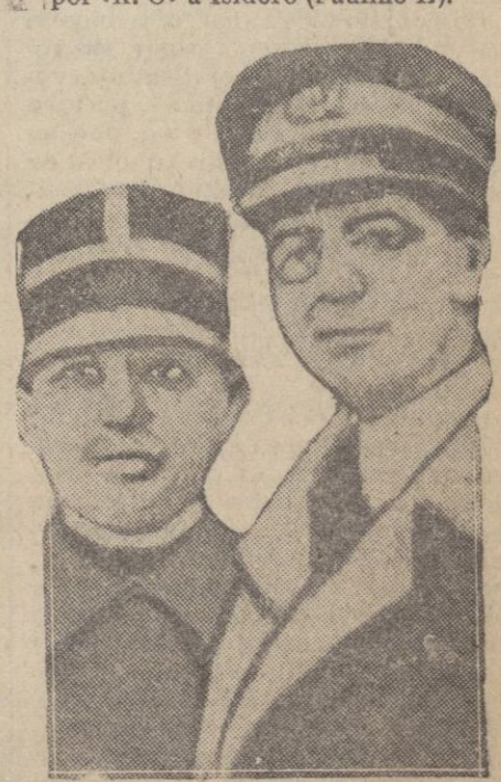
OSLO.—A la izquierda, el teniente suco Quindors que salvó a Noble y a su lado el capitán de corbeta de la misma nacionalidad que pilota el hidro «Iplano», que tan grandes servicios presta en el salvamento.

PASATIEMPOS El flecha de mar o calamita volante, es un curioso molusco que nada a flor de agua mediante impulsos tan energéticos, que a veces sale disparado fuera del agua como una flecha, de donde deriva su nombre vulgar. En ocasiones, dando esos saltos, ha caído dentro de las embarcaciones.