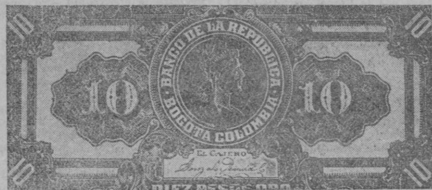
BARCELONA.—Anverso y reverso de los billetes del Banco de Colombia falsificados.