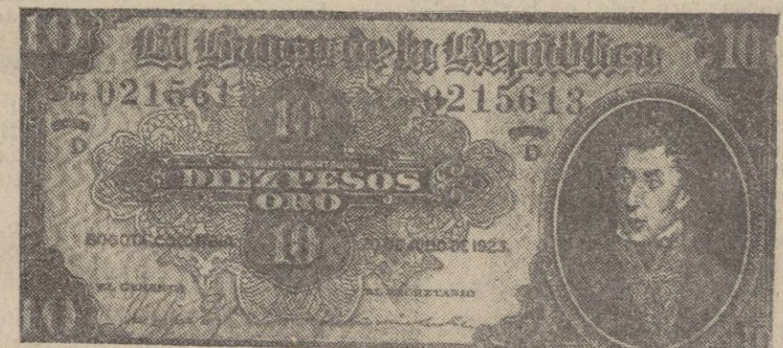
BARCELONA.—Anverso y reverso de los billetes del Banco de Colombia falsificados.