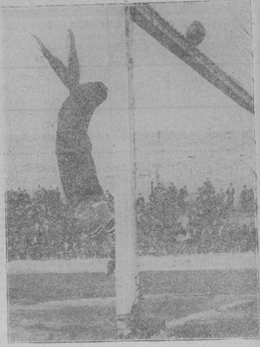
MADRID.—Una estirada del portero del «Levante» en el partido jugado contra el «Real Madrid», en el que empataron a un tanto.