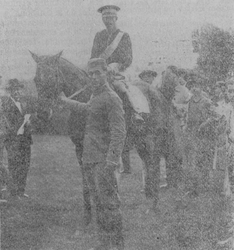
MADRID.—El caballo «Fleur de Mumbé» que ganó el premio Humareda en la carrera militar de vallas. Promete ser un caballo formidable.

Cunde el entusiasmo en todo Mallorca ante la proximidad de los dos grandes partidos, que prometen revestir solemnidad inusitada y convertirse en uno de los mayores acontecimientos futbolísticos que en Mallorca se hayan celebrado. En muchas tiendas eléctricas se reúnen los aficionados para contemplar las fotografías de los formidables equipos europeos o para enterarse de los pormenores de los encuentros. Ayer comenzaron a repartirse los programas, anunciando la organización de trenes especiales, tal es de grande el entusiasmo que hyen todos los pueblos.