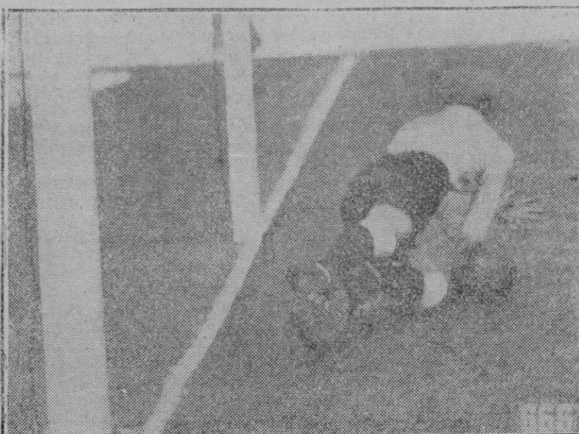
AMSTERDAM.—Del último partido entre Argentina y Uruguay, en donde se ve a Bozío el portero argentino, en un momento de peligro, que salvó con gran acierto.