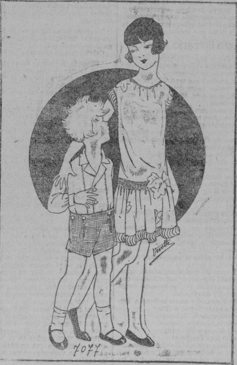
PANORAMA LENCERIA.—1 Brusita de crepón de china blanco guardaneca de batistas a mano a la que se abotona una pequeña «collette» de lana «rotilet» bolsillos por delante.—2 Vestido tafetán rosa guardaneca de «bouillonnés».—Aplicaciones de hojas de terciopelo verde.

ciña la cabeza y el ramillete de flores que se verá bajo las alas. Imposible negar que la idea es verdaderamente original y bonita.