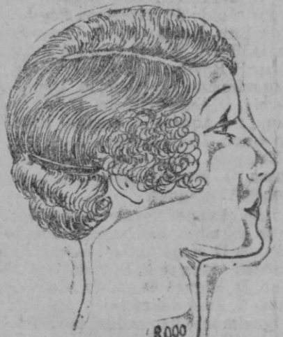
PEINADO.—Habiendo vuelto la moda de las ondulaciones, los cabellos deben ser más largos. Bucle y ondas cubren la nuca y la oreja, pero no caen en el cuello como antes gracias a la peñecilla que completa el adorno, cuando está puesta con gusto en el punto querido. No ha quedado siempre la peñeta siendo uno de los adornos indispensables del peinado?

Para terminar, dos palabras sobre un nuevo sombrero recién lanzado, que permite poseer dos sombreros en uno solo, lo cual es una originalidad apreciable. Imagínese un casco ceñido de raso negro, con el lado izquierdo adornado por un ramillete de flores y se tendrá la primera combinación. La cual, enseguida, para que tenga un aire más estival, se escondrá bajo una espelina de paja azul o rosa, que, a guisa de adorno, tomará del casco mencionado, la banda que