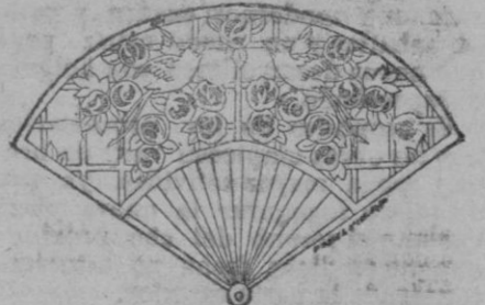
ABANICO DE PAJAROS.—Esta bonita decoración verdaderamente tiene un trazo común con la obra de los abanicos de mariposas. Aquí los pájaros cantan entre las flores.

Grosellas rojas y blancas ponen su nota fría y alegre alrededor de un rostro que encuadran muy irregularmente.