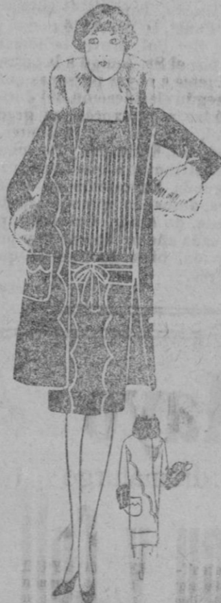
VESTIDO Y SOMBRERO.—Traje de pñlo encarnado cuyo cuerpo es de crepón de china rojo plisado. Nervuras en dientes. Cuello y puños rosgendin.

La chaqueta es redonda de un bonito movimiento, a veces sin cuello, — novedad divertida — adornada con reverses de gamuzas.