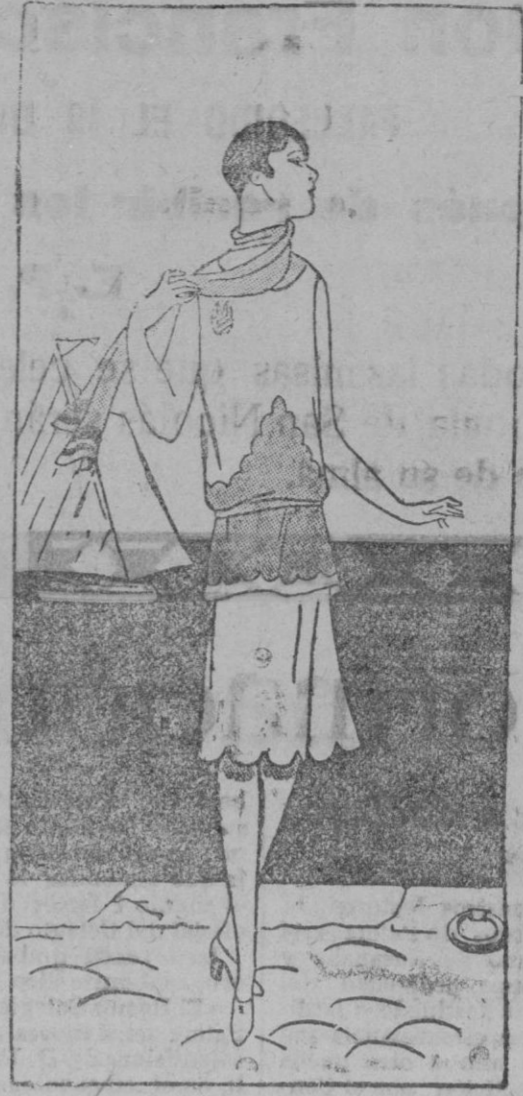
VESTIDO.—Pequeño-vestido de terciopelo rosa. Dos volantes en forma que suben sobre el lado.

Una oficiala del Ejército, ocupa un cuarto modesto y limpio, recibiendo 27 chelines por semana, con los cuales debe mantenerse y ejercer la caridad. No da limosna, sino que vende a un precio ínfimo, ropas usadas, zapatos viejos y una porción de cosas