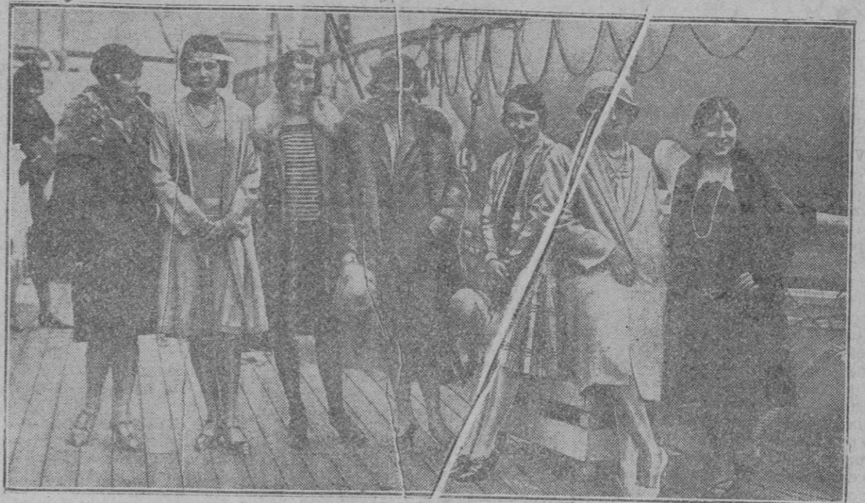
De izquierda a derecha: Mis Luxemburgo, Mis Italia, Mis Inglaterra, Mis Alemania, Mis Bélgica, Mis Francia y Mis España, a bordo del buque que las conduce a los Estados Unidos para tomar parte en el Concurso Internacional de Belleza que va a celebrarse en Galveston.

Anthony Asquith, hijo del fallecido duque de Oxford, ha aparecido en su segunda película Underground. La primera fue Shooting Stars. El título