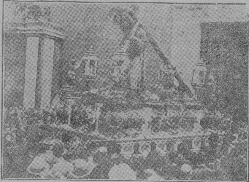
SEVILLA.—Semana Santa.—Nuestro Padre Jesús del Gran Poder.

REDACCION Y TALLERES: Calle de los Olmos, 2. ADMINISTRACION: P. Cort, 30.—Teléfono n.º 6.