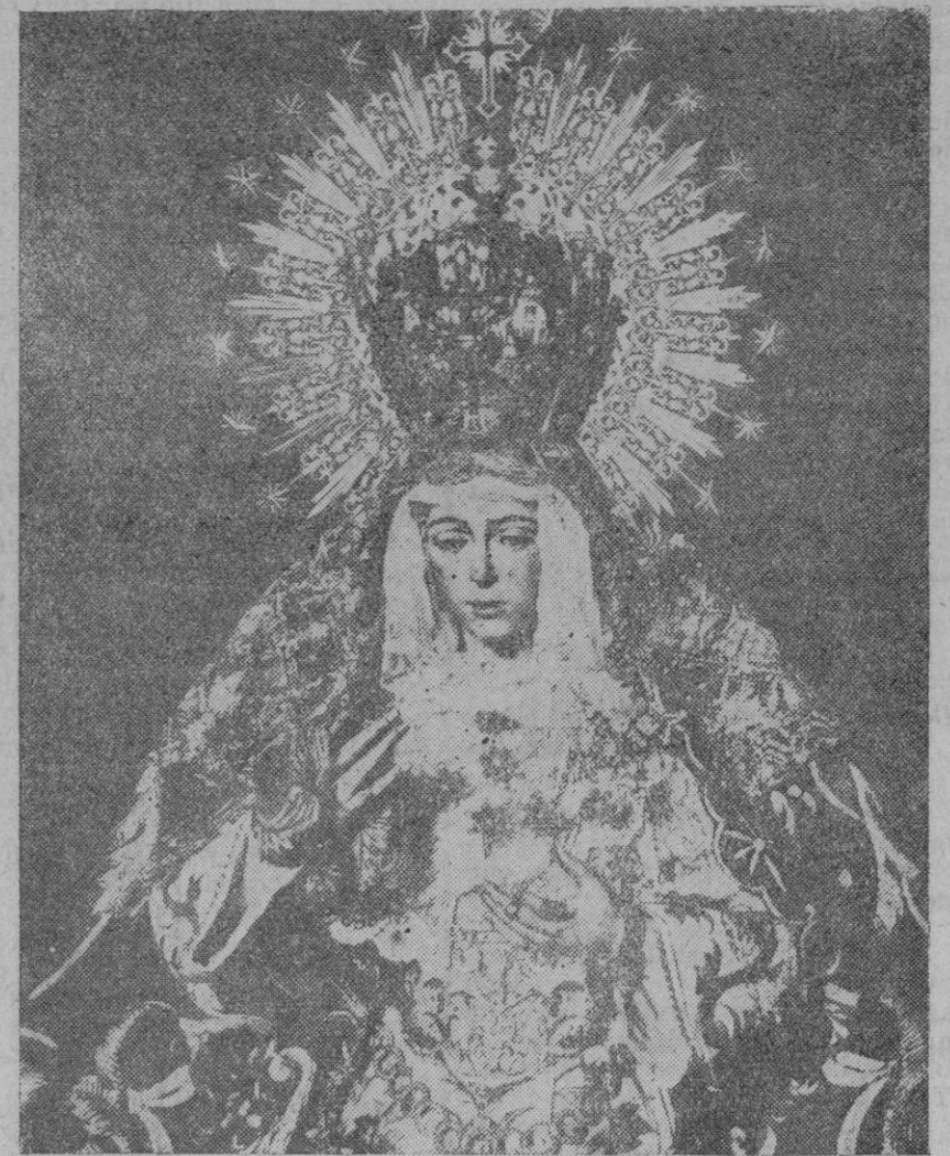
SEVILLA.—Semana Santa.—Nra. Sra. de la Esperanza, vulgo de la Macarena.

Lo cierto e indudable es que la narración evangélica en ninguna parte señala, ni mucho menos asegura, la doble flagelación, aun contando con lo escrito en el capítulo 26, de San Mateo. Ni como a hombre libre, aunque criminal, le azotaron; sino como a vil esclavo; porque nosotros, verdaderos esclavos del pecado, fuésemos todos libres, ocn noble, aia y verdadera libertad, no la que hoy se expende y vende harto cara. Baronio (ad ann 34) sostiene lo mismo, diciendo ser costumbre en el imperio flagelar al hombre reo, pero libre, con varas y cuerdas; más al esclavo, con duros azotes; conviene a saber, con cuerdas nudosas y extremos de hierro. Fundando Baronio y muchos otros sabios cristianos en la autori-