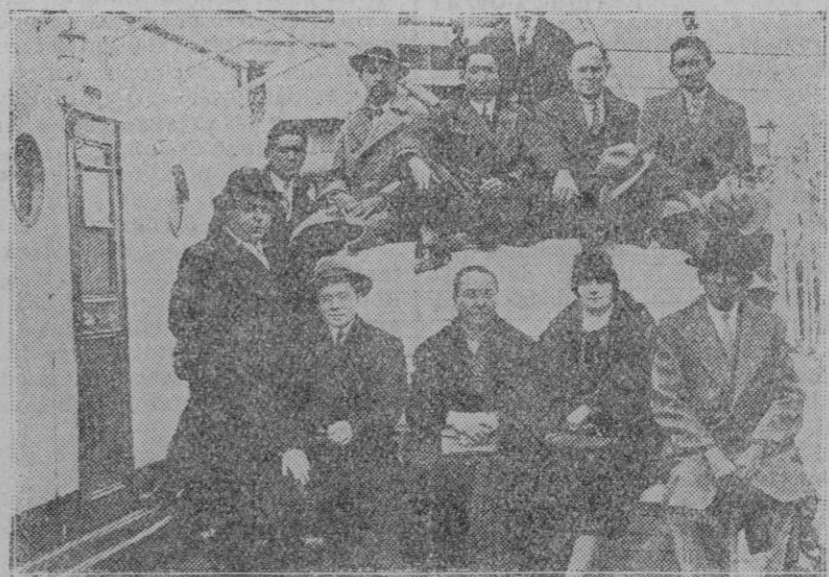
LA CORUNA.—Llegada de los matadores de toros Fermín y Juan «Armitas» (1) y (2) respectivamente a bordo del vapor en que han venido de Méjico. El último, que ya ha tomado la alternativa y tiene 16 años, dicen que es un fenómeno.