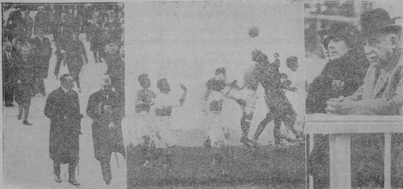
MADRID.—En la izquierda, llegada al Stadium del Rey y de los personajes e Infante y del Embajador de Portugal a presenciar el partido España-Portugal. En el centro: un momento de peligro ante la meta portuguesa al ser tirado un corner. El Presidente del Consejo, presenciando el partido.