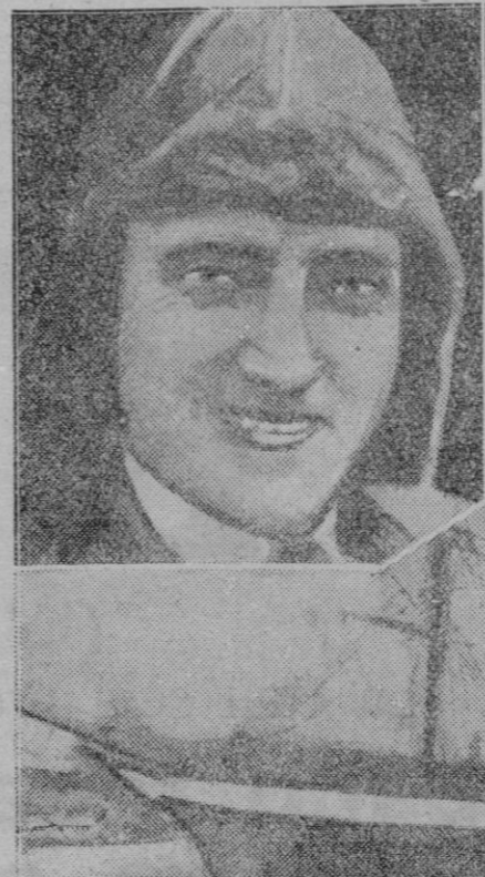
NUEVA YORK.—El famoso aviador Bird, que emprenderá el día a otro su expedición aérea al Polo Sur, yendo por el Norte.—Ya ha sido trasladado el avión gigante a Wirmir, para emprender el vuelo.—En la foto se ve el aviador y el buque que irá también a la expedición.