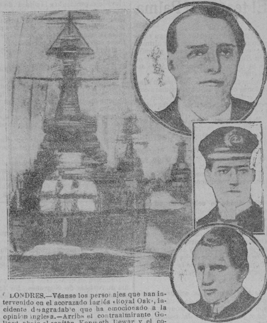
LONDRES.—Véanse los personajes que han intervenido en el acorazado inglés «Royal Oak», incidente de «agradable» que ha emocionado a la opinión inglesa.—Arriba el contraalmirante Gullard, abajo el capitán Kenneth Dewar y el comandante de navío Daniel, protagonistas del suceso y que han sido suspendidos de sus funciones.