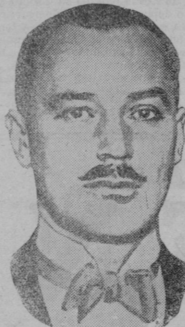
El Alto Comisario de Inglaterra en Egipto que ha dirigido a Sarwat Pachá primer ministro del Gobierno egipcio, ha enérgica nota en la que se afirma el derecho de la Gran Bretaña a montar un control militar y a proteger los intereses de los extranjeros.