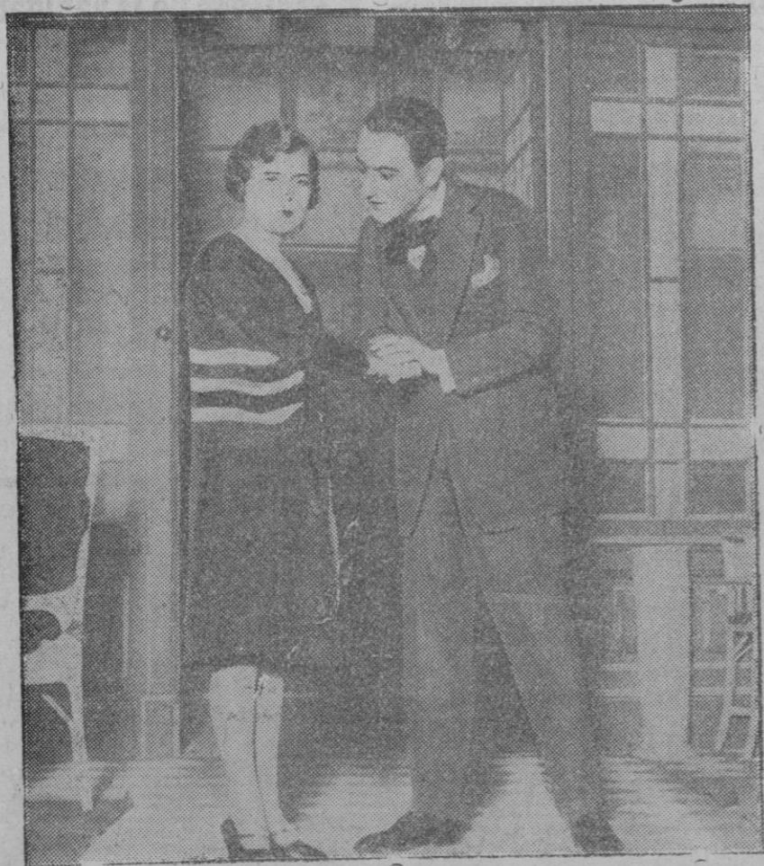
MADRID.—Una escena de la comedia «Por el nombre» que se ha estrenado en el teatro Infanta Isabel, alcanzando gran éxito.