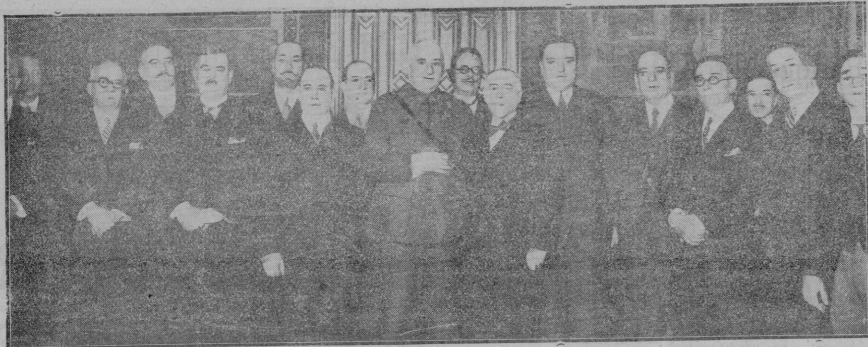
MADRID.—El 21 del actual verificóse en el Ministerio de Estado, la reunión de los representantes diplomáticos americanos con el Presidente del Consejo, el Ministro de Fomento y los Comisionados Regios de las Exposiciones de Sevilla y Barcelona, y se acordó después de algunas consideraciones hechas por el Presidente, que la inauguración de la Exposición de Sevilla sea el 15 de Marzo de 1929 y la de Barcelona el 1.º de mayo del mismo año.