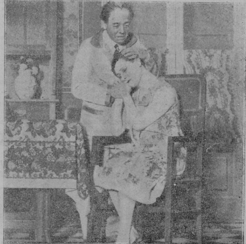
MADRID.—Una escena de la comedia «La Lola» de los señores Muñoz Seca y Pérez Fernández que se ha estrenado en el teatro de la Latina con gran éxito.