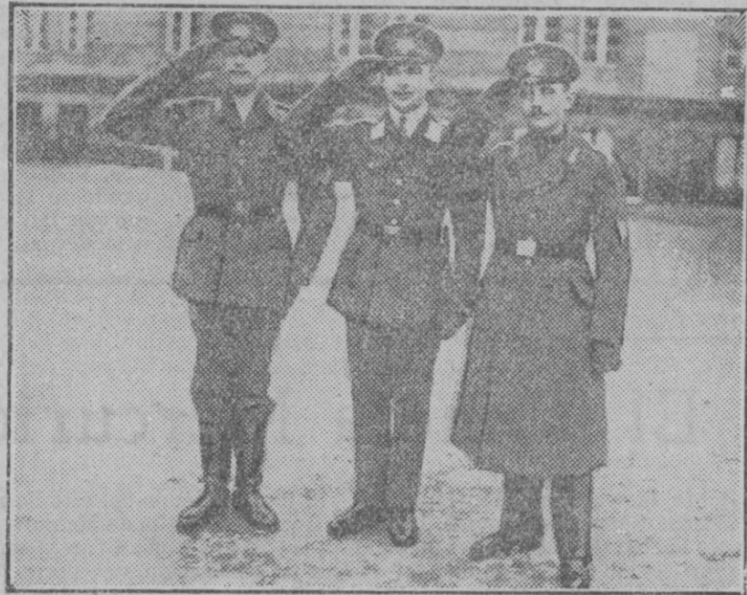
Modelos del nuevo uniforme adoptado por Alemania para su ejército, y que primero fué adoptado por Inglaterra, luego otros países y entre ellos el nuestro.