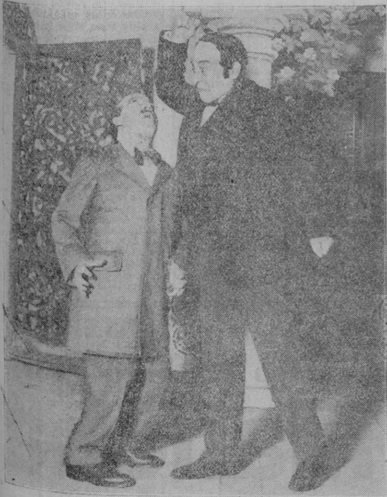
MADRID.—Una escena de la obra de los señores Paso y Estremera titulada «Tu serás mío!», estrenada el miércoles con gran éxito en el teatro Cómico.