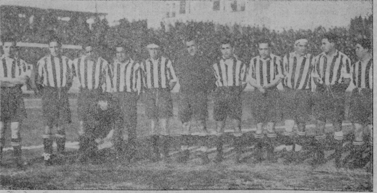
El notable equipo madrileño que ha quedado campeón de la región centro.