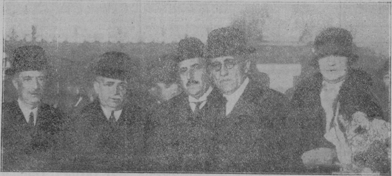
MADRID.—Momento de partir para Cadix don Ramiro de Maestu, rodeado de los Ministros de Gracia y Justicia e Instrucción, donde embarcará con rumbo a la Argentina.

Varios automovilistas que habían abandonado sus coches provisionalmente se quedaron sorprendidos al ver que éstos emprendían la marcha y desaparecían velozmente. Un camión de mercancías que estaba parado en la esquina de Eldon Road fué lanzado por el tifón a una velocidad considerable, en medio de la frecuentísima Green Lane, y chocó con un carro cargado de sacos de carbón, del que tiraban varios caballos.