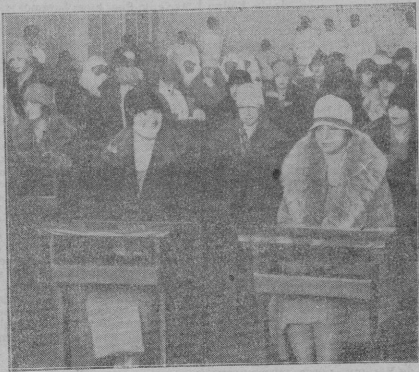
MADRID.—En el Hospital Central de la Cruz Roja enclavado en la Avenida Reina Victoria se ha inaugurado el curso de enfermeras. El acto fué presidido por la infantita Beatriz (X) que hizo su examen e ingresó como enfermera siendo cariñosamente acogida por todo el personal.