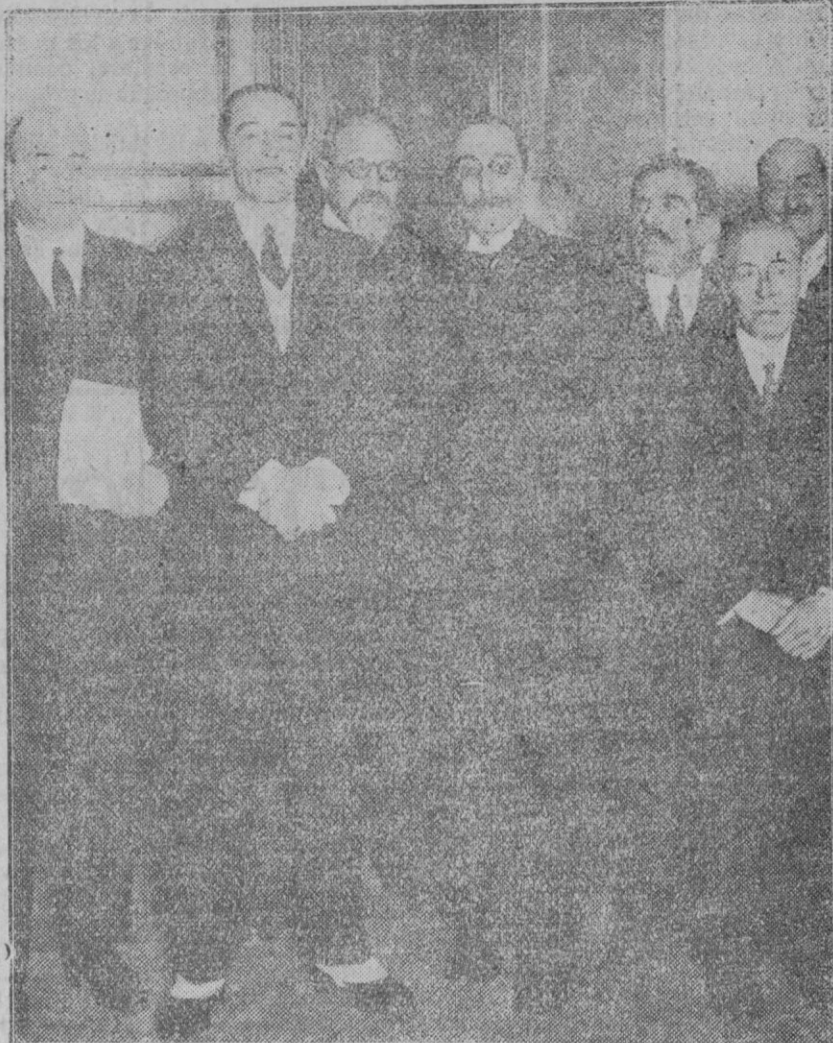
MADRID.—Reunión de la Academia de la Historia en que quedó admitido como Presidente de dicho organismo el ilustrado Duque de Alba, como ya anticipamos en días anteriores.