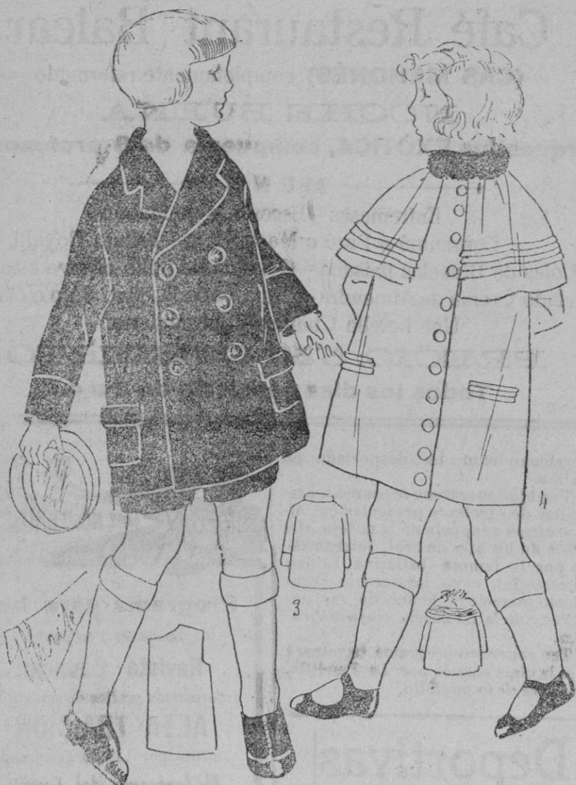
ABRIGO DE NIÑA Y ABRIGO DE NIÑO.—Abrigo chico y sencillo de paño gris, botones del mismo tono.—Un encantador abrigo «a pelerina», cuello nutria, botones de tela, pliegues a la «pelerina».