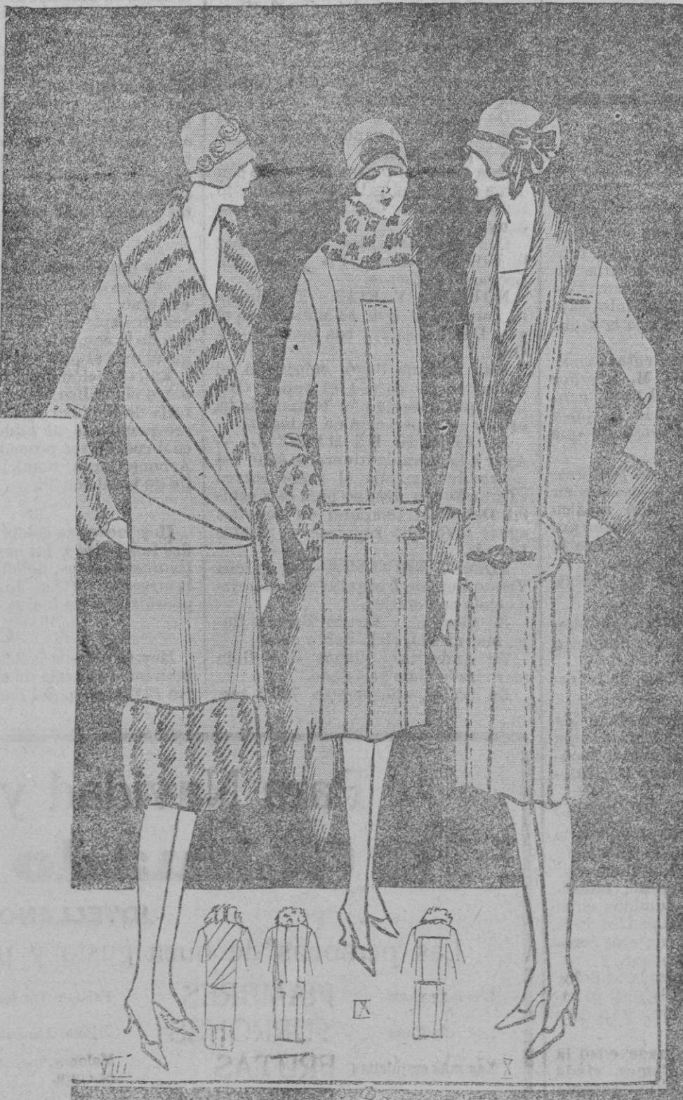
PAÑORAMA ABRIGOS.—Abrigo de terciopelo ligero, roud lle, guarnecido de piel fantasía.—Tela: 4 metros en 1 m. 10.—Abrigo de paño écaille guarnecido de tirre.—Tela: 4 metros en 1 m. 30.—Abrigo de terciopelo lana azul guarnecido de piel de beige o gris.—Tela: 4 m. en 1 m. 30.