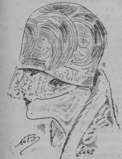
SOMBRERO.—Esta bonita toca de los bordes bajos va recubierta de pequeños adornos de pavo real. Velo por la cara.

Junto al Louvre, sobre la fachada de un gran almacén, ha colocado una instalación perfecta de fuegos artificiales. Incesantemente, brotan docenas de cohetes voladores de esos que trazan una estela de fuego en el aire y estallan después suavemente para deshacerse en flores coloreadas. Luego, se quema un castillo, después una rueda. De un modo permanente, corre la pólvora, como si se tuviera de ella una provisión inagotable, ante