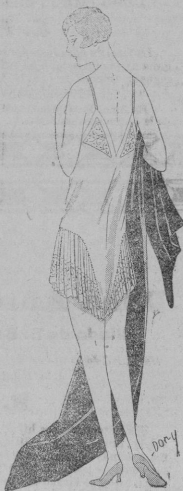
PANTALON-COMBINACION.—He aquí la figura pantalon combinacion que cubre el corsé. Se hace de crespón de china rosa con incrustaciones de Venecia ocre. Los anchos volantes forman pantalon reuniéndose por una «pata» entre las piernas. El escote, muy acentuado por detrás, permite el uso de nuestros actuales vestidos de noche.

DESHABILLES: Se ven encantadores de franja rosa, bordeados con