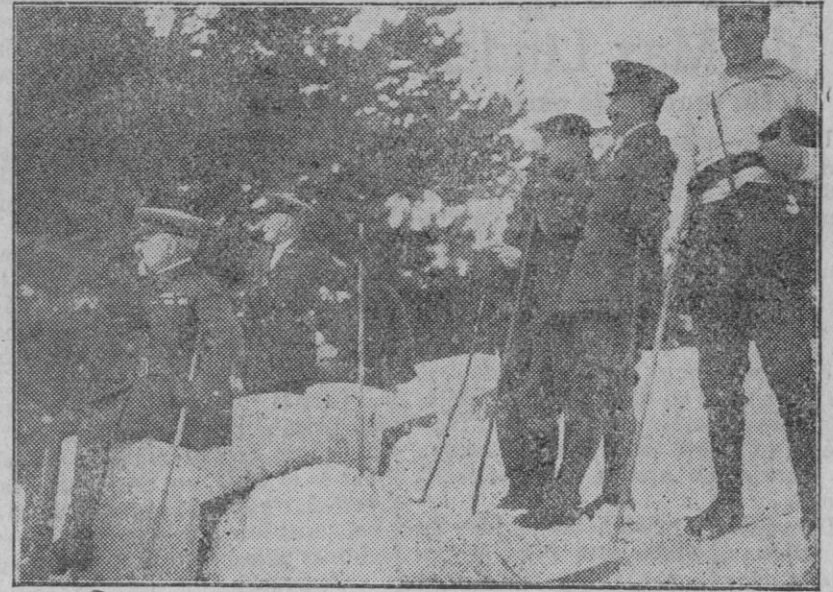
El domingo, en la sierra del Guadarrama, los Jefes y oficiales presenciando las prácticas militares alpinas, realizadas por las tropas en la nieve.

hermosamente sonrosado y lozano. Dicha cera se usa por las noches, retirándola a la siguiente mañana con un poco de agua tibia. Este procedimiento tiende también a limpiar los poros obstruidos, facilitando la función respiratoria de la piel, conservando así el color natural y hermoso del nuevo cutis. Si, al pedir usted una caja de cera mercollizada, le preguntan si la quiere grande o chica, recuerde que las tales «cajas chicas» no son de verdadera cera mercollizada, constituyendo una burda y perjudicial falsificación desprovista de todo poder hermoseador.