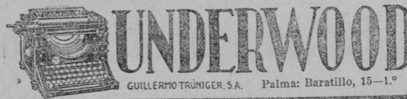
GUILLERMO TRÚNIGER, S.A. Palma: Baratillo, 15—1.º