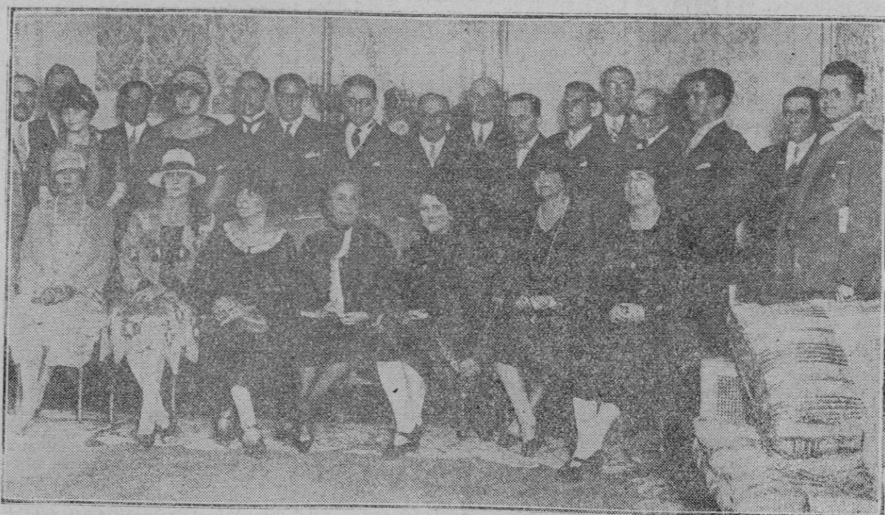
EN LA LEGACIÓN DE MÉJICO EN MADRID Reunión celebrada por la colonia mejicana para celebrar la fiesta nacional de su país.