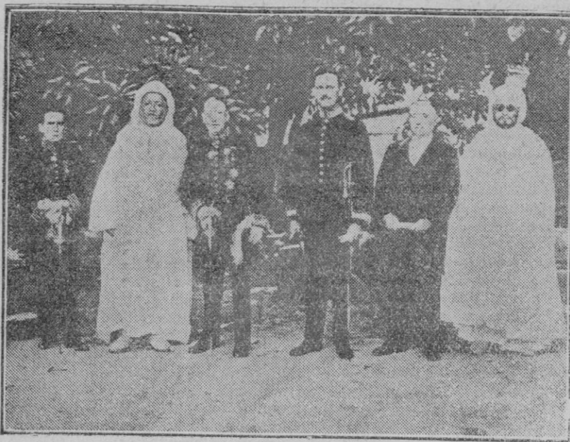
EN LOS JARDINES DE LA MEMDUBIA.—TANGER Recepción del Cuerpo Diplomático por el Mendub, en conmemoración del Nacimiento del Profeta.

Medios para conseguirlo, la provincia los tiene, si en esta empresa hubiese la voluntad que se ha manifestado en Asturias ante un caso semejante.