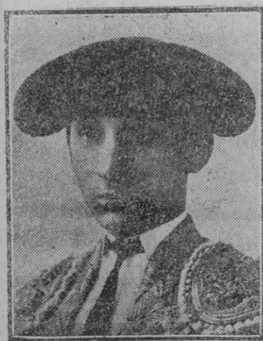
El diestro Vicente Barrera que tomó la alternativa en Valencia de manos de Juan Belmonte.