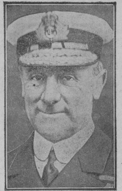
El Almirante inglés conde de Jellicoe, que ha tenido una destacada actuación en la conferencia naval de Gónova.

A los tres meses regresó a Londres y allí comenzó la tragedia. Su esposo no la reconoce. Ve, desde luego, que aquella es su mujer, pero otra mujer distinta y que además no le gusta. Se siente en ridículo, teniendo que dar a todas sus amistades y parientes explicaciones de un cambio tan extraordinario, y ha planteado el divorcio.