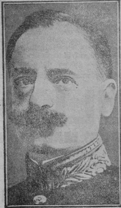
El Ministro de la Guerra belga M. de Broqueville, que ha denunciado que Alemania, contraviniendo el tratado de Versalles, se está armando en secreto.

«Tengo sesenta años de edad y parece que no tengo más que veinticinco, como puede usted observar, y mi eterna juventud es debida a que vengo observando unas prácticas higiénicas que me dan excelente resultado».