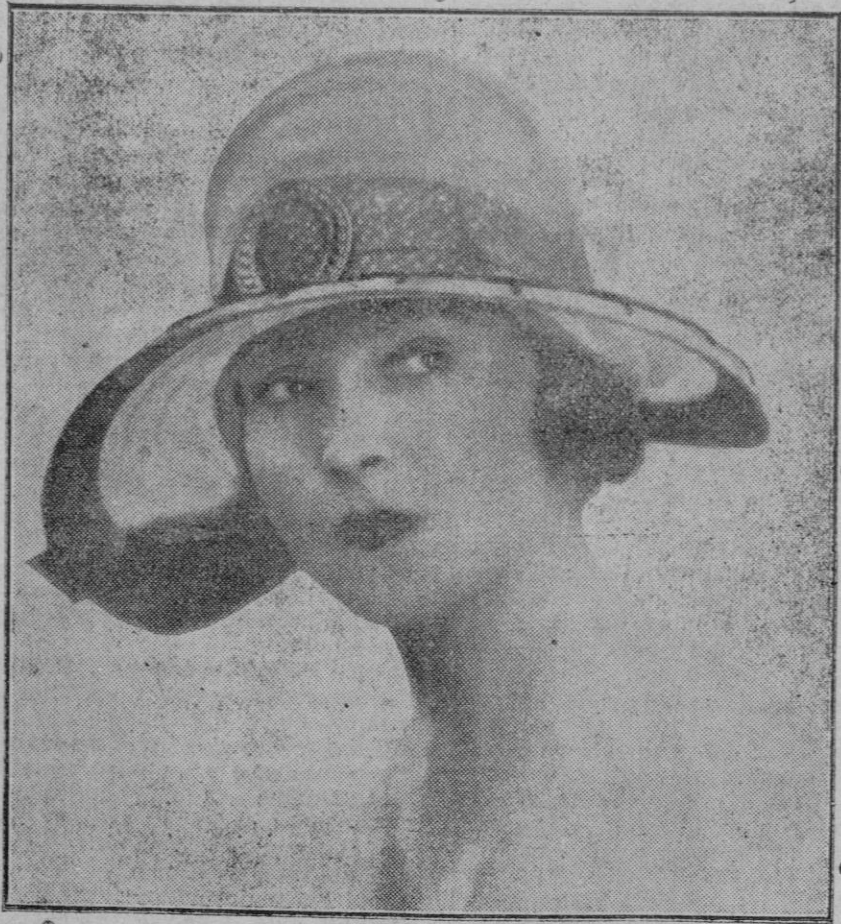
LA MODA DE PARIS

Sombbrero de paja verde ajeno sencillamente adornado con una cinta mordore.