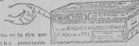
Esto es la tira que debe recortarse.

Representantes generales para España: Establecimientos Dalmáu Oliveres, Sociedad Anónima, P.º Industria, 14, Barcelona.