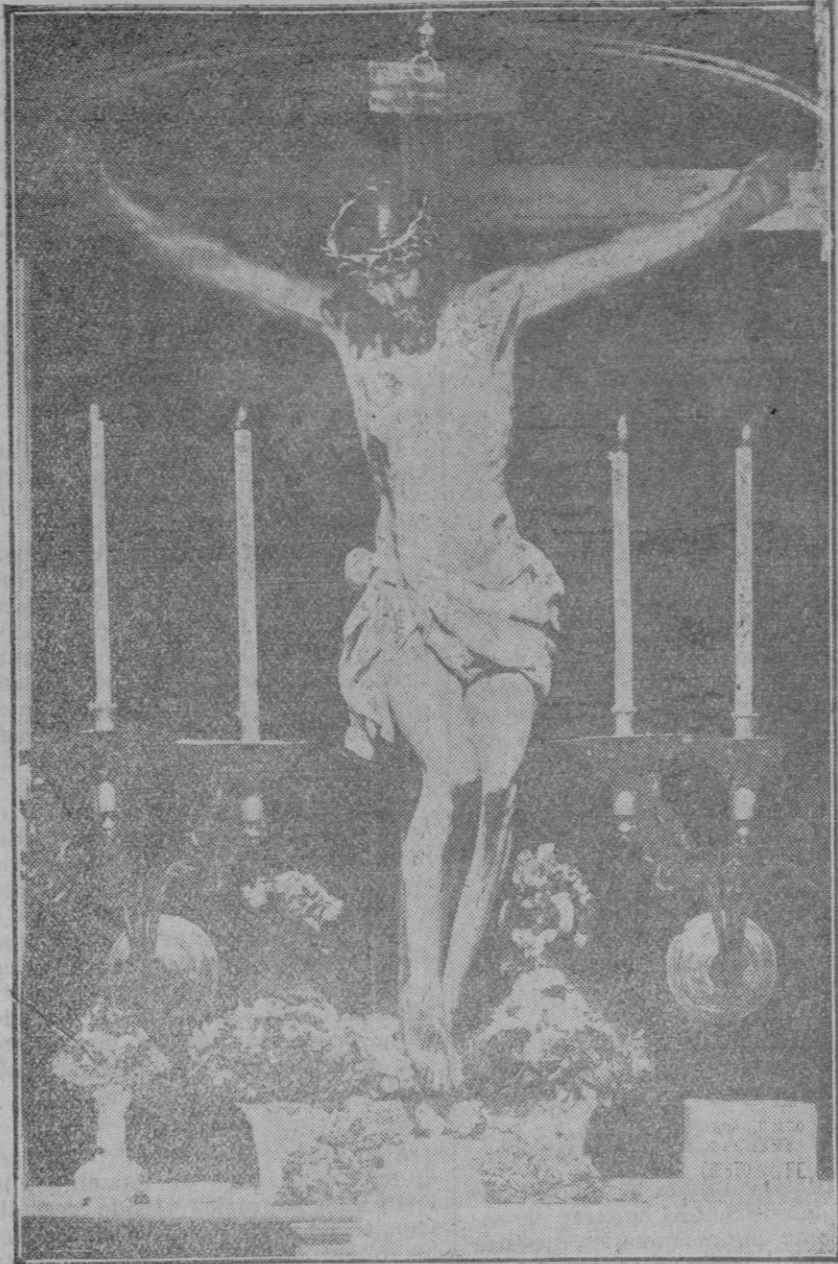
Cristo de la Fé, que se venera en la Iglesia Parroquial de San Luis Obispo, de Madrid.

Basados en tal costumbre no faltan historiadores que suponen que el título condenatorio de Jesús debió ser por El conducido al cuello, o bien si no por algún otro de la comitiva. Otros observan que para obviar este olvido hizo que fuera fijado en la cruz. Sabido es que la inscripción llevaba el título: «Jesús Nazareno, Rey de los judíos». Era redactada en tres lenguas distintas: hebrea, griega y latina. La primera se empleó por ser la lengua nacional; la segunda, por ser hablada en casi todos los países, y la tercera, por ser considerada la oficial del Estado, especialmente de los Poderes judicial y ejecutivo. El pretor romano fué el autor de tal inscripción, queriendo demostrar con