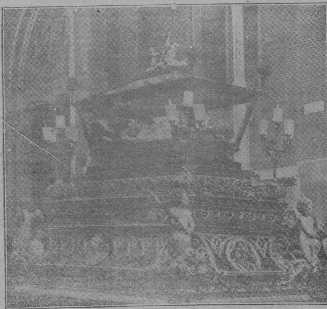
V.º - R.º., del Stmo. Cristo de la Vida Eterna, Propiedad de la Cofradía de San José, que se venera en la Iglesia de Santa Cruz, de Madrid.

Mas la presente generación, renegado, descastada, de su noble abuelo, pretende desconocer de quién ha recibido la herencia que está dilapidando, con disoluta prodigalidad, en orgías desenfundadas y excesos de todo género; y para paliar su ingratitude, llama menguados los bienes que heredó, y atribuye a su propio esfuerzo los frutos naturales que recoge de la pasada florecencia.