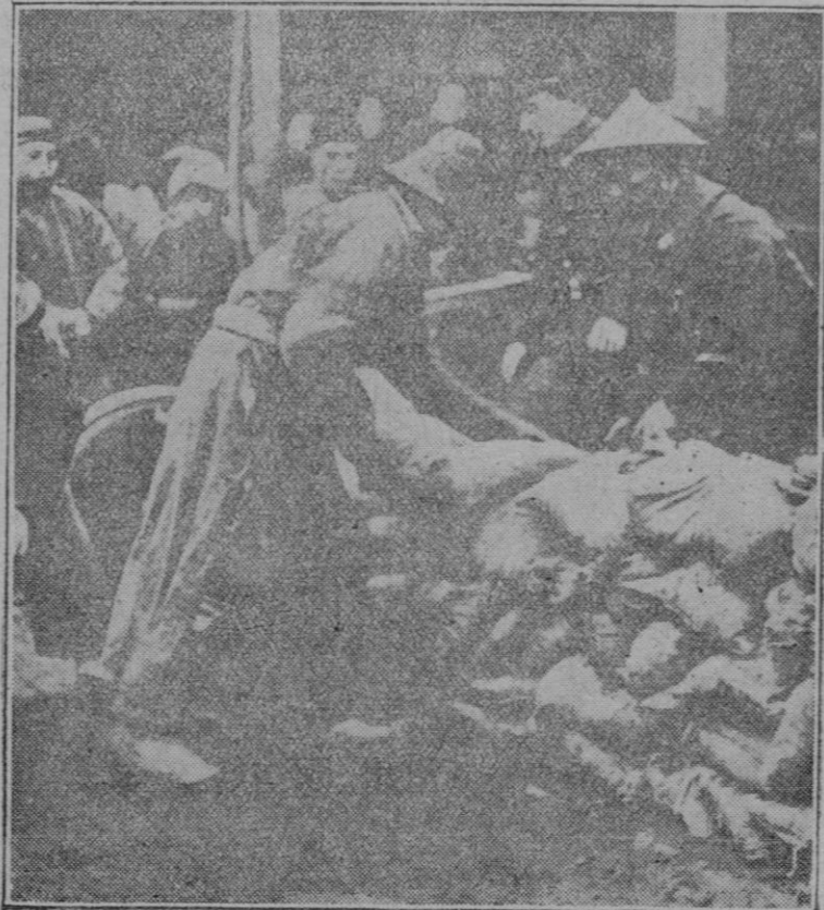
SHANGHAI.—LA LUCHA EN LAS CALLES

Completa devoción a Dios y a la Iglesia; servir con bravura a la patria y al rey; defender a los débiles, particularmente a las viudas, los huérfanos y las doncellas, salvo en el caso de que a tal defensa se opusieran los intereses del rey; no ofender, con malicia, a nadie; no cometer usurpación alguna y combatir a los usurpadores; someterse en todos los actos de la vida a los impulsos del sentimiento del honor; no sostener lucha sino por el