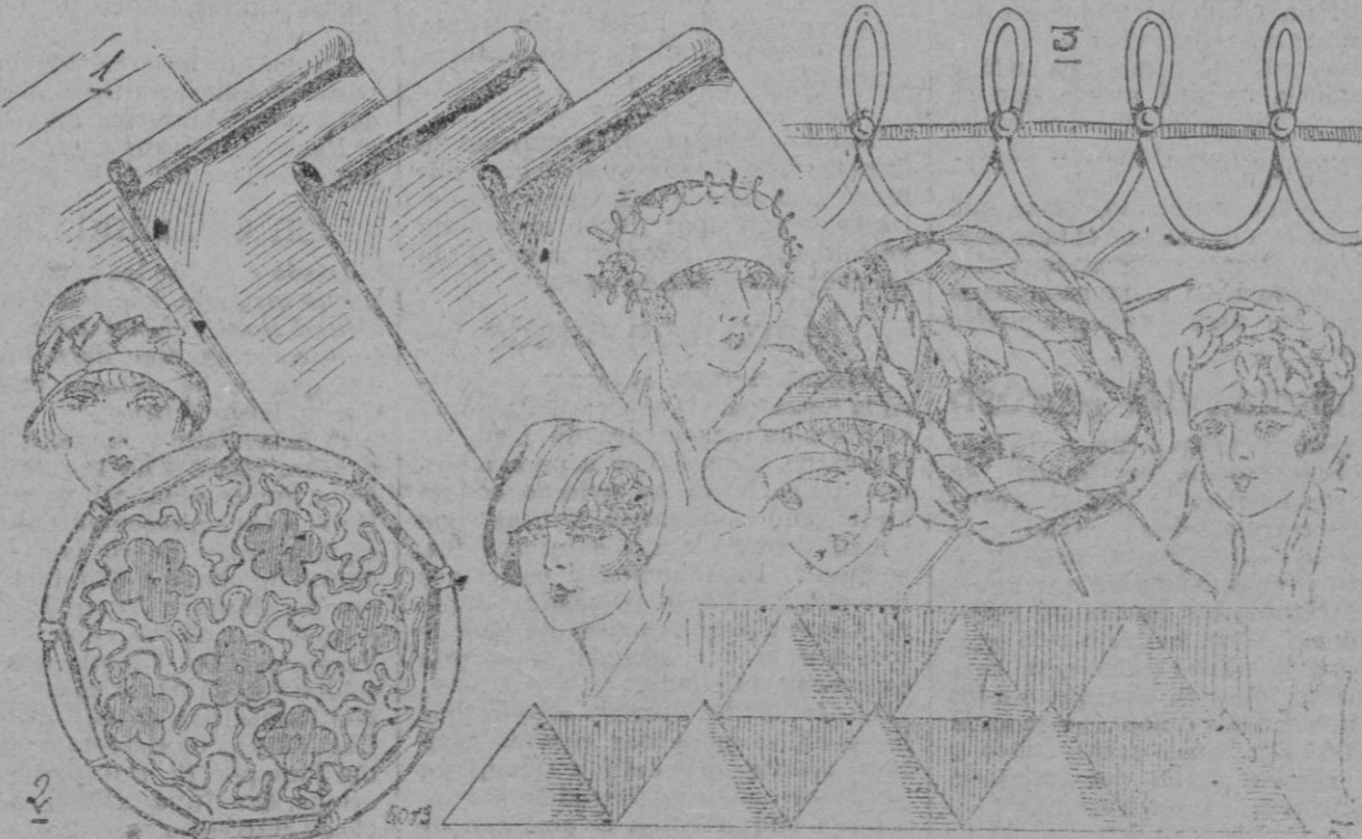
PANORAMA ADORNOS.—1. Acha cinta de paja enrollada componiendo un bonito adorno y moderno.—2. Los macarones hallan buen éxito. Este es compuesto de fina gansa y flores recorridas.—3. Un galon redondo y perlas metálicas son artísticamente dispuestas en el borde de un sombrero.—4. Los terciopelos mattés se hallan frecuentemente sobre las tocas con los puntos lanzados.—5. Puntas de cinta dispuestas de cierto modo forman una alta cintura a los sombreros de formas nuevas.

Jesús, doctor, meditaciones sobre el evangelio, por Max Caron, 4-50 id. Garibaldi (memorias revolucionarias), versión española de Odón de Buen, (dos tomos), 6 id. La revolución francesa, por Edgard Quinnee, 5 id. De venta en la Librería de José Tous.