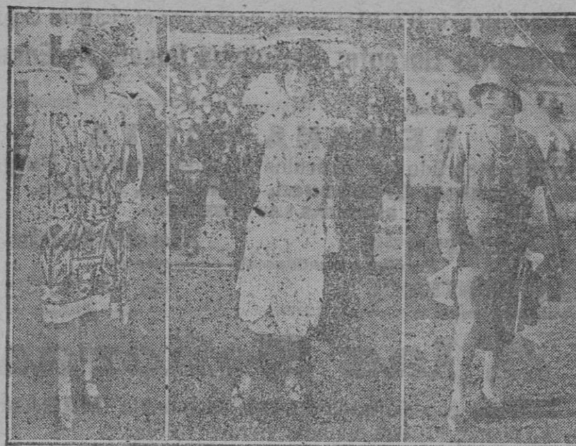
LA MODA EN LAS CARRERAS. Las toillettes de verano han hecho ya su aparición. He aquí algunos de los modelos que más llamaron la atención en las carreras de Auteuil (Clixé «Cellón Paris»)

Eche aproximadamente 2 cucharadas de stallax granulado (que puede obtenerse en cualquier farmacia), en 1/2 litro de agua caliente, deje que se disuelva y iselo después como un shampoo común. Si no desea, no es necesario enjuagar después el cabello, pues aún sin ello, el stallax lo deja en excelentes condiciones.