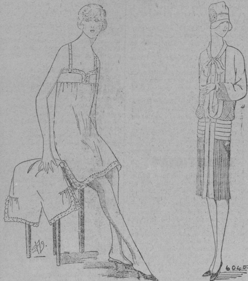
JUEGO DE LENCERIA.—Hallamos en esta figura el modelo de una camisa y de un pantalón surtidos; estos juegos tienen siempre muchas fervientes. Estas dos piezas son en velo de seda rosa y grueso tul crudo, rebordado. La camisa es ligeramente abierta en el costado.