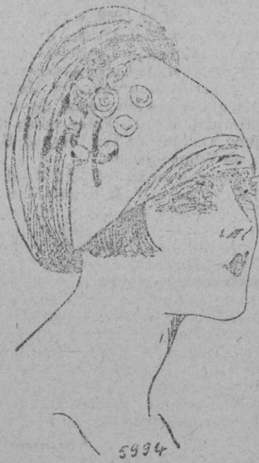
SOMBRERO.—Boina toquete de fayo de paja cosida, encañado vivo, adornada con una banda de fieltro surtido y con una flor de gansa y perlas de madera del tono.

El cuello vuelto cerrando la parte alta del traje es adoptado generalmente y no es nunca vulgar, nos recuerda el cuello Claudina, pero con algo más de gracia. Se puede cerrar por un pequeño ramo y se componen encantadores con materias originales.