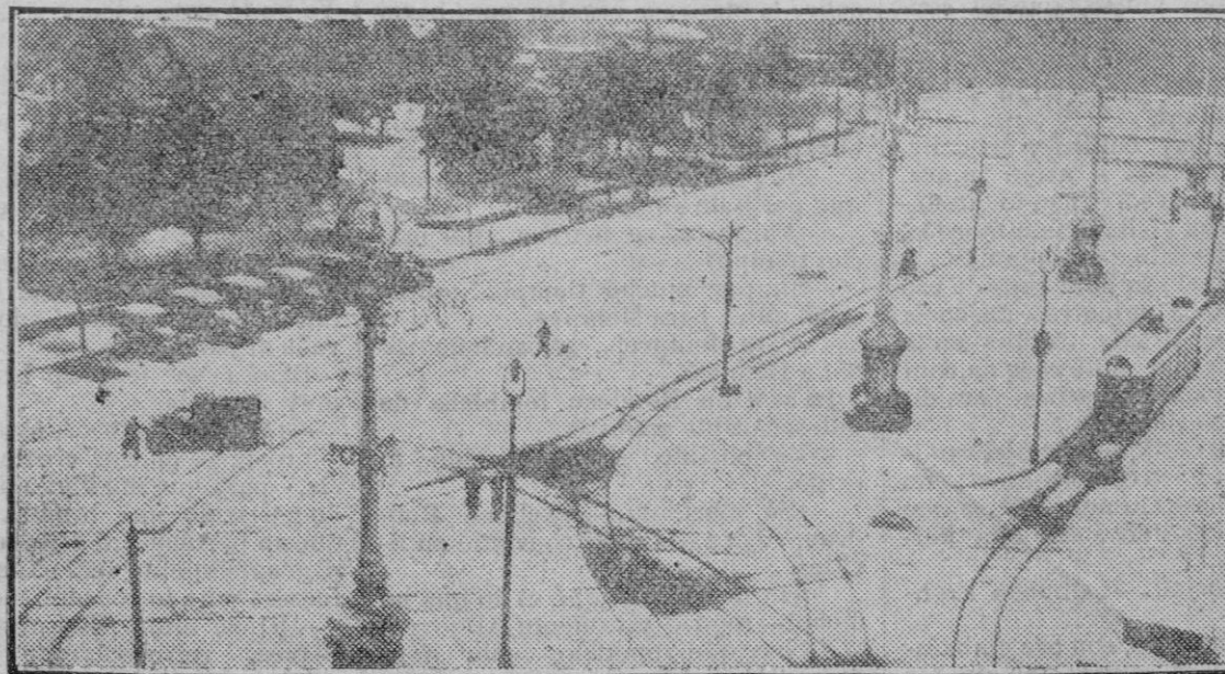
SANTANDER.—Piñerosco aspecto de la Avenida de Alfonso XIII y jardines de Pereda, después de la nevada