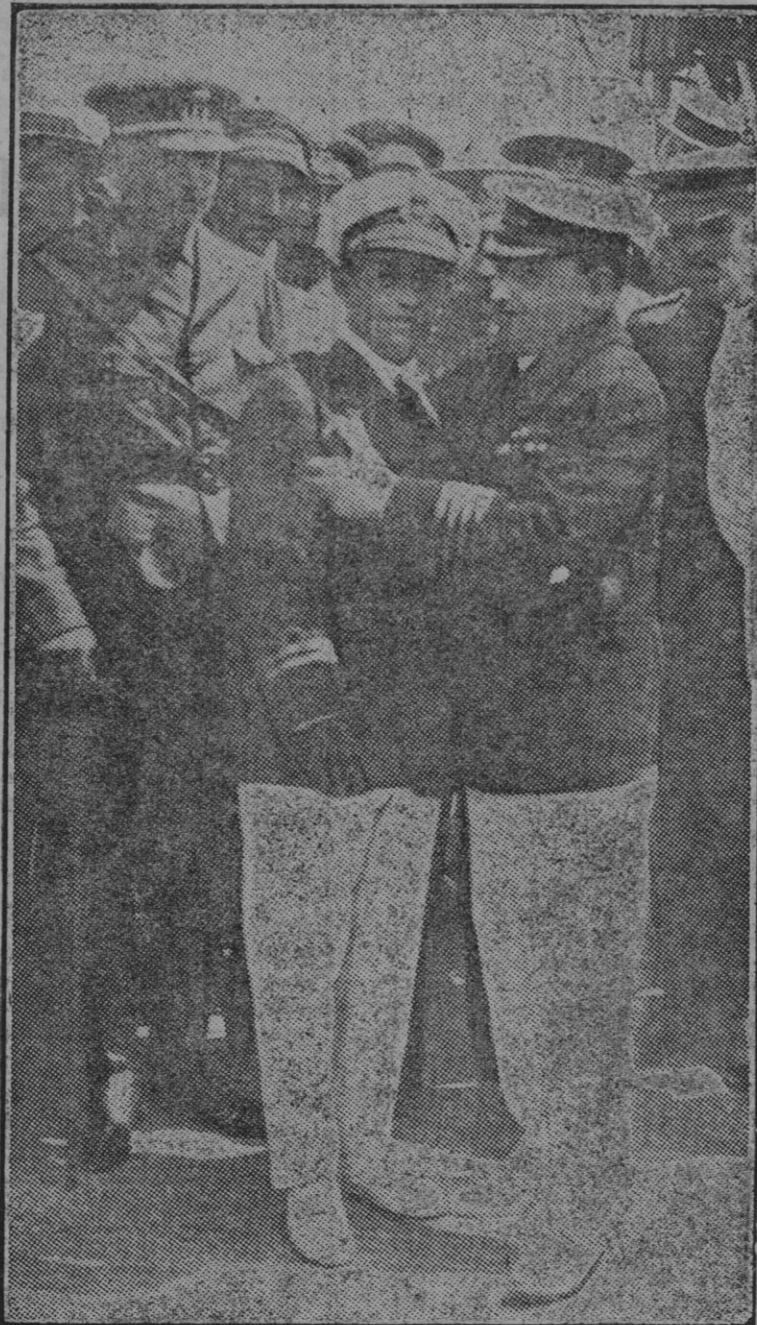
BARCELONA.—EN LA AERONAUTICA NAVAL