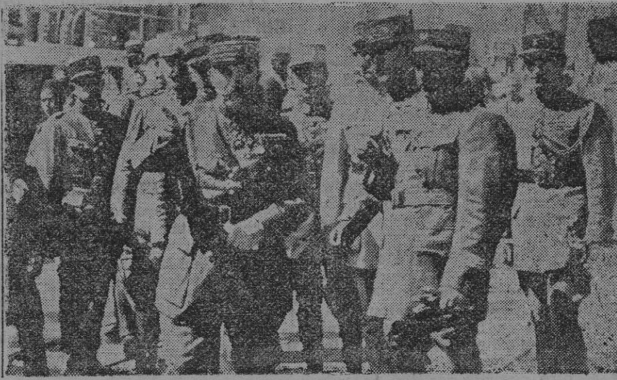
FRANCIA EN MARRUECOS.—En el centro, el general Naulin, al tomar posesión del mando de las tropas en Marruecos.