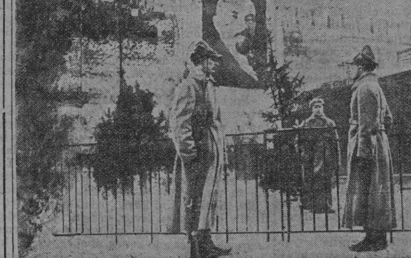
EL NUEVO DIOS RUSO.—La imagen de Lenine, colocada delante de su tumba, es guardada militarmente día y noche.