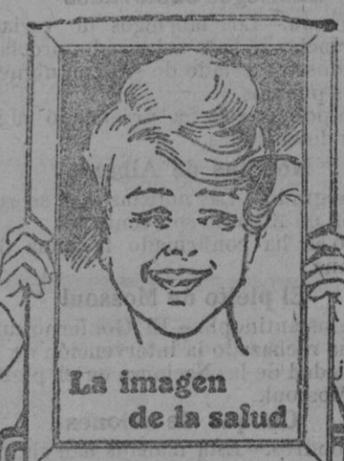
La imagen de la salud

125—SAN MIGUEL—125 (CERCA LA PLAZA DEL OLIVAR)