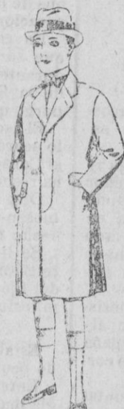
Gabanes de patén, para niños de 10 a 15 años. de ptas. 22 a 90.