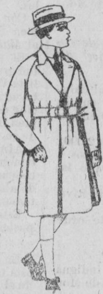
Gabanes de patén, para niños de 4 a 9 años. de ptas. 30 a 55.