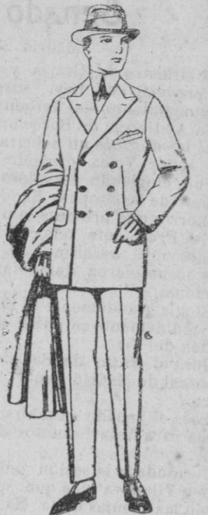
Trajes de cheviot, mel-tón, vicuña o jerga. de ptas. 65 a 150.