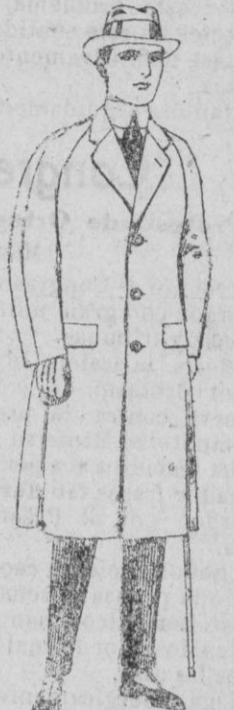
Gabanes de patén, mel-tón o cheviot, con forro de seda, satén o escocés. de ptas. 68 a 155.

Ropas confeccionadas para Caballero, Señora, Niño y Niña Gorras, Sombreros, Cinturones, Calcetines, Corbatas, Fajas, Ligas, Tirantes, Pañuelos, etc.