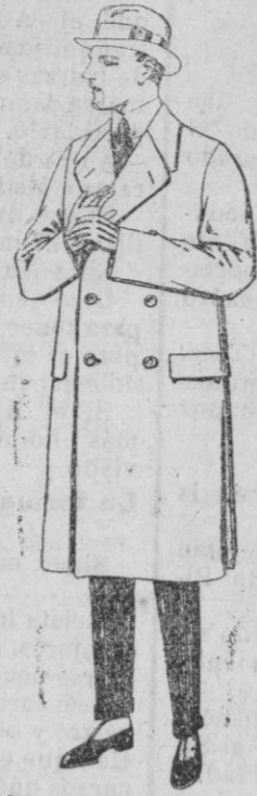
Gabanes de patén gamuza ó cover. de ptas. 70 a 100.

MADRID, BARCELONA, ALICANTE, ALMERIA, BILBAO, CADIZ, CARTAGENA, GIJON, GRANADA, MALAGA, SANTANDER, SEVILLA, VALENCIA, VALLADOLID Y ZARAGOZA