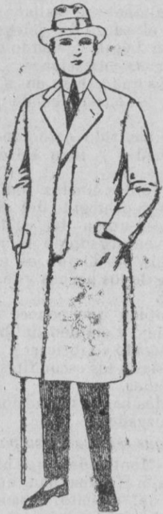
Gabanes de cheviot, gamuza, patén, etc. de ptas. 43 a 70.