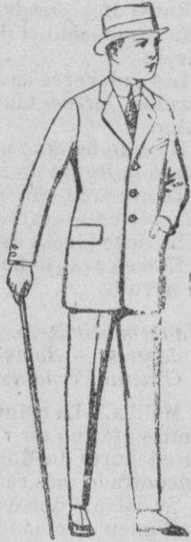
Trajes de patén, vicuña o jerga para niños de 10 a 12 años. de ptas. 30 a 78. Los mismos para jovencitos de 13 a 16 años. de ptas. 33 a 80.