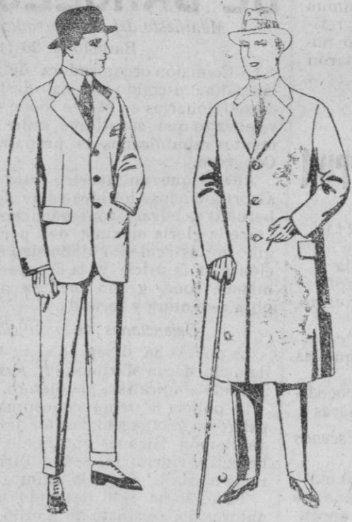
Trajes de cheviot, mel-tón, vicuña o jerga. de ptas. 33 a 135