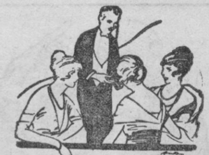
Es el que gastan las personas distinguidas, y el que regala participaciones de la LOTERIA DE NAVIDAD.