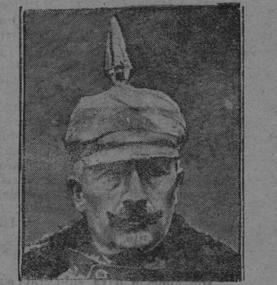
Última fotografía del Kaiser

Estamos obligados a reconocer, de acuerdo con el almirante Percy Scott, que los dreadnoughts no valen de ningún modo los montones de oro que cuesta su construcción y su acción en los mares; los submarinos los reemplazarán seguramente, como los automóviles han reemplazado a los coches de caballos. El torpedo matará al obús.»