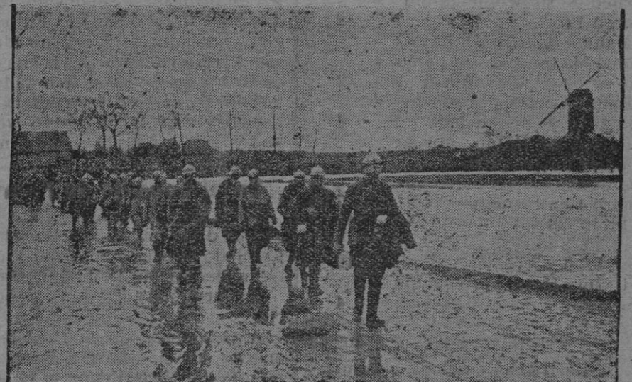
De vuelta de las trincheras de primera línea