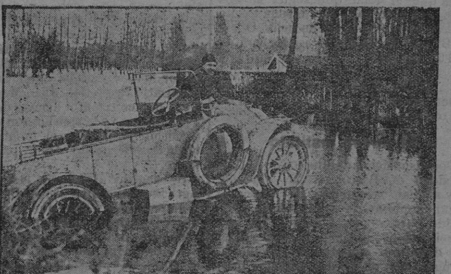
Dificultades de la locomoción en la guerra