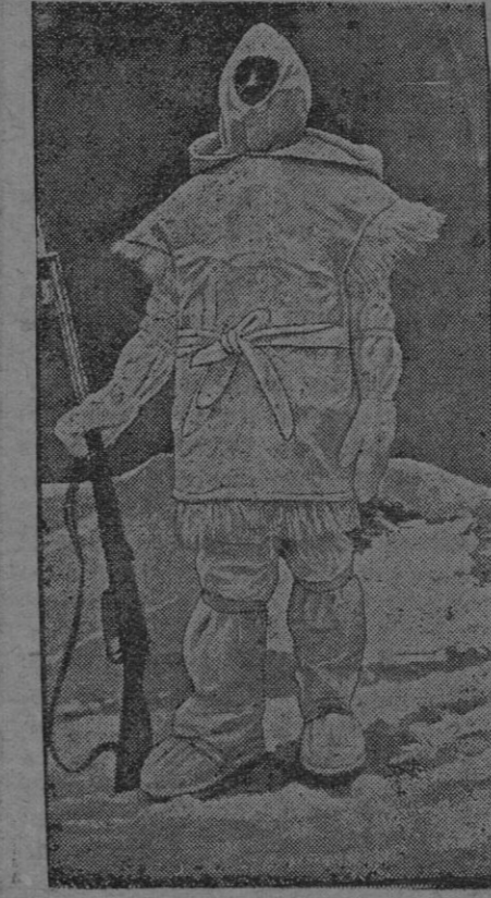
Centinela en el frente italiano