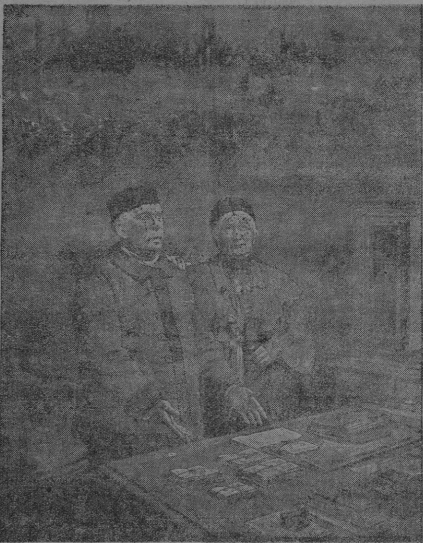
EL EMPRESTITO NACIONAL (De un dibujo de «La Ilustración») La economía francesa es la que nos ayudara a combatir y vencer. (Palabras del Mr. Ribot, en la Cámara.)