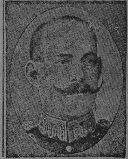
Constantino XII, Rey de Grecia

una grande extensión de terreno, y por eso lo habían fortificado de tal modo que la consideraban en absoluto inexpugnable. Por lo mismo, nos era indispensable la posesión de dicha fortaleza para el buen éxito de nuestra ofensiva.