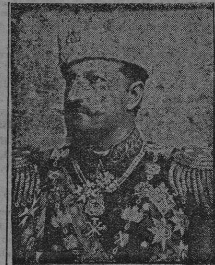
Fernando I, Zar de Bulgaria

En dichas profecías estaba previsto el resultado desastroso de la primera guerra báltica, y también que la resurrección de Turquía y el restablecimiento de sus antiguas glorias seguirían a esta catástrofe preliminar.