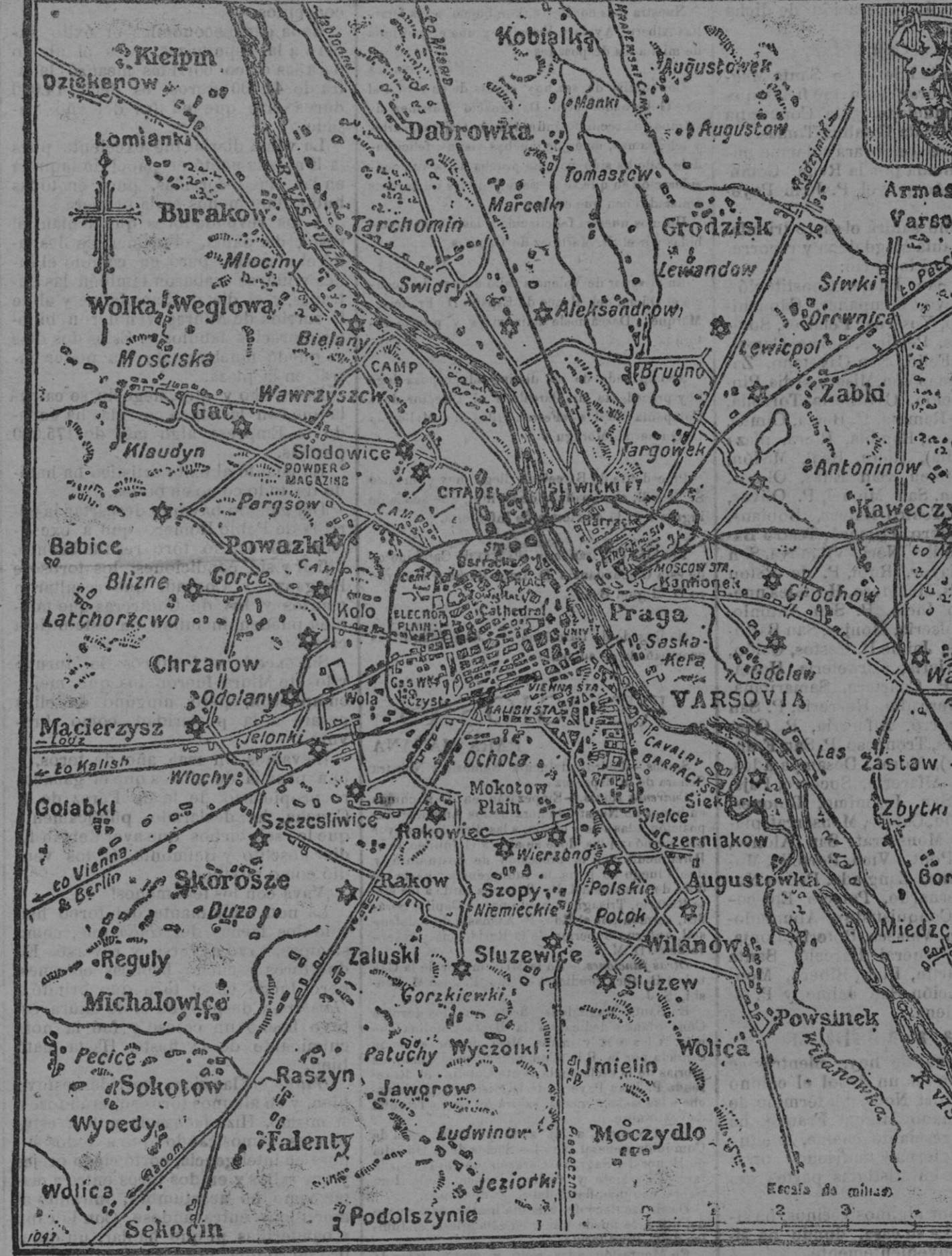
EL SITIO DE VARSOVIA. - Plano de la plaza, sus fortificaciones y sus alrededores

Varsovia, capital del distrito, de gobierno y de la Polonia. Situada a 109 metros de altura en la orilla izquierda del Vístula. Tiene 600.000 habitantes y ferro-carriales a San Petersburgo, Teresopol, Ivangorod, Viena y Bromberg.