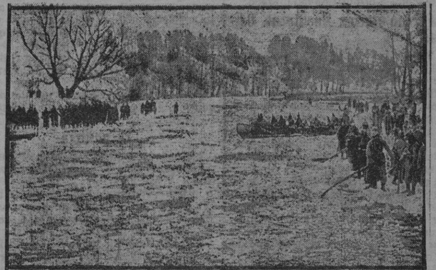
Soldados alemanes rompiendo el hielo en la Prusia Oriental