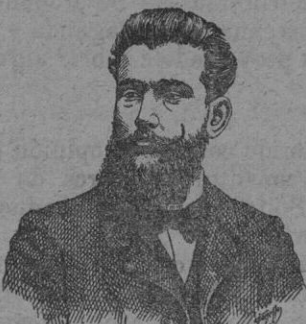
I. Freixas Romera Farmacéutico ARIBAU, 13.—BARCELONA

son infalibles para curar la Tos, Asma, Bronquitis, Ronquera, Catarros bronco-pulmonares, Resfriados y demás infecciones del pecho, que devolveré su importe á toda persona que habiendo tomado cinco cajas como máximo, no haya conseguido la curación más radical. Esta es la más grande garantía que puede darse á un enfermo.