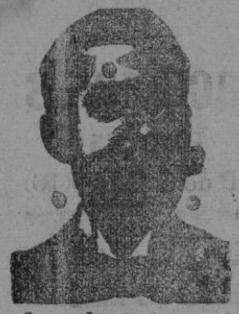
Angelo Costanzi Diputación, 435, ent. Barcelona

Compañía de seguros contra incendios y explosiones de toda clase A PRIMA FIJA Domiciliada en Barcelona, Dormitorio de San Francisco, núm. 5.