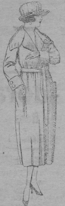
Abrigos de gamuza, pañete, etc., en negro, azul y color, adorno respuntés seda. De Ptas. 70 á 110