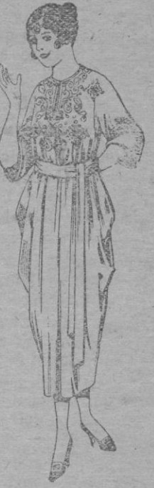
Batas de franela, adornos bordados. De pts. 45 á 60. Surtido de batas en franela y lana. De pts. 14 á 60

Ropas confeccionadas para Caballero, Señora, Niño y Niña