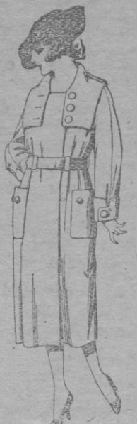
Abrigos de cheviot, ratina, pañete, etc., en azul y color, para jovencitas de 12 á 16 años. De pts. 38 á 60