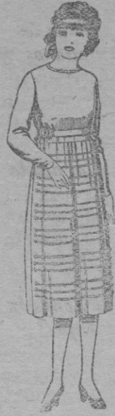
Vestidos de sarga inglesa, estambre, etc., en azul y color, para jovencitas de 12 á 15 años. De pts. 52 á 80