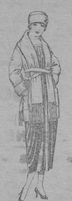
Paletots de punto de lana, cuello bufanda. De pts. 52 á 60