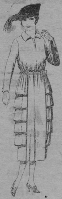
Vestidos de sarga inglesa, estambre, lanilla, etc., en negro, azul y color. De pts. 110 á 145

Madrid, Barcelona, Alicante, Almería, Bilbao, Cádiz, Cartagena, Gijón, Granada, Málaga, Santander, Sevilla, Valencia, Valladolid, Zaragoza