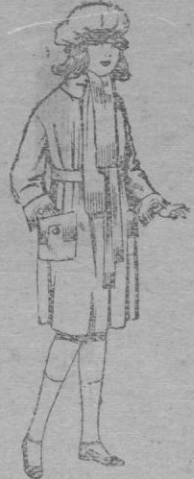
Abrigos de gamuza, pañete, cheviot, etc., en azul y color, para niñas de 4 á 9 años. De pts. 36 á 50