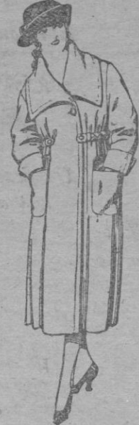
Abrigos de gabardina, gamuza, etc., en azul y color, para jovencitas de 12 á 15 años. De pts. 42 á 100