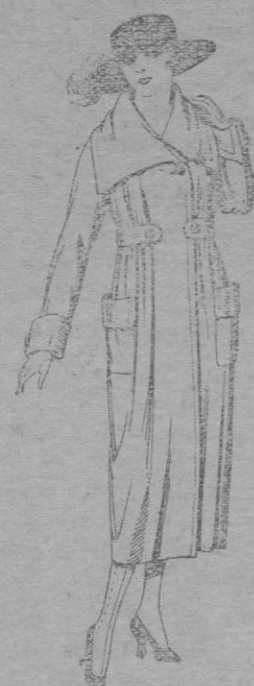
Abrigos de cheviot, etc. en negro, azul y color. De pts. 56 á 100