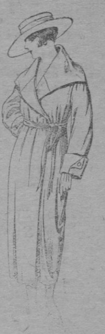
Vestidos de gabardina, estambre, sarga, etc., en negro, azul y color. De pts. 98 á 135