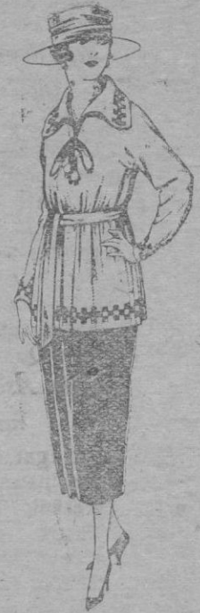
Paletots de punto de lana, diferentes colores. De pts. 34 á 50