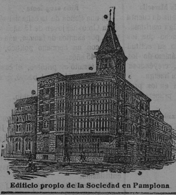
Edificio propio de la Sociedad en Pamplona

ESTABLECIMIENTO EN PALMA DE MALLORCA Jaime II,