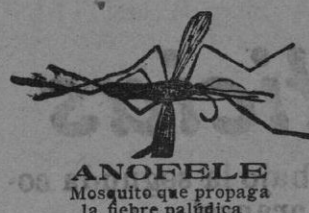
ANOFELE Mosquito que propaga la fiebre palúdica