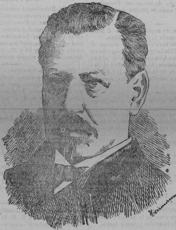
† DON TOMÁS AGUILÓ

En la estadística demográfica correspondiente al año 1888 figuran 9808 defunciones causadas por la tisis. Comparada esta cifra con la del año anterior resulta que en 1887 murieron 525 más que en 1888. En 1886 es menor la mortalidad que en 1885, pero se observa un aumento notable y progresivo desde 1879 hasta 1885. Durante el quinquenio de 1879-83 murieron de tisis pulmonar 47.457, personas (promedio anual 9491'40); en el de 1884-88, el